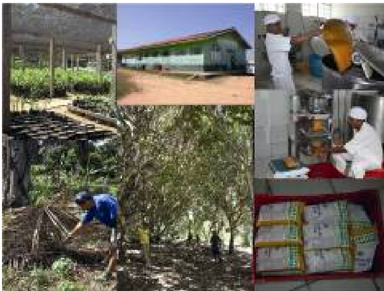
Figura 4: Da muda à polpa de fruta, processo de valorização das frutas na APA do Igarapé Gelado