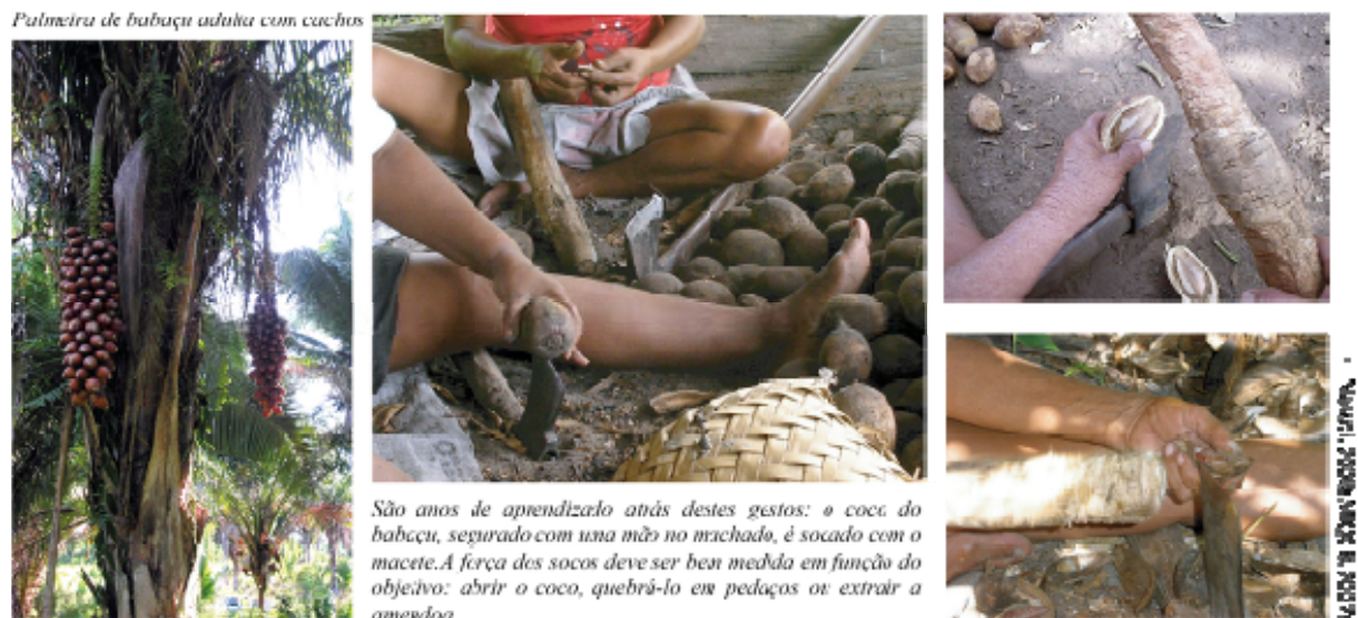
Figura 2: Palmeira de babaçu e técnica da quebra do coco

Verdadeira afirmação cultural das quebradeiras de coco, esta certificação informal expressa tanto a origem do recurso (unidade de conservação) quanto a identidade histórica (saberes tradicionais transmitidos de geração em geração). Além disto, ela beneficia da caução institucional do IBAMA, atestando uma produção em harmonia com a natureza, assim como do MIQCB, que afirma a identidade das produtoras.