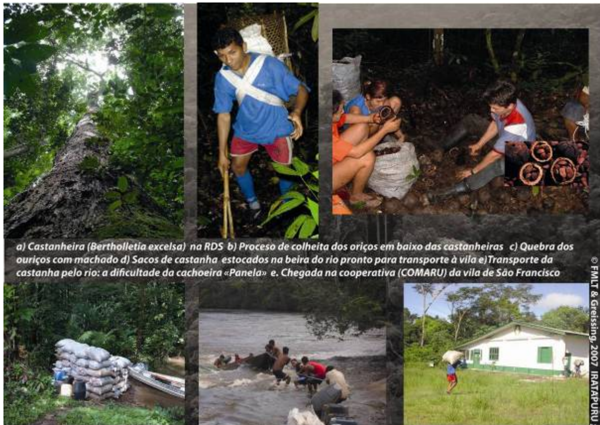
Figura 3: Colheita da castanha pelos extrativistas de São Francisco na RDS Iratapuru

mente servido ao desendividamento da cooperativa. De fato, a Natureza impôs um controle estrito sobre o uso desse fundo para evitar que o dinheiro seja desviado para outros fins; no entanto, o fato da empresa reter o dinheiro já provocou muito descontentamento na comunidade que afirma que o dinheiro está ficando nas mãos da liderança da cooperativa em vez de servir para projetos comunitários de caráter social e cultural. Estão notadamente reivindicando a criação de um posto de saúde, o aprimoramento da escola e a construção de um centro comunitário.