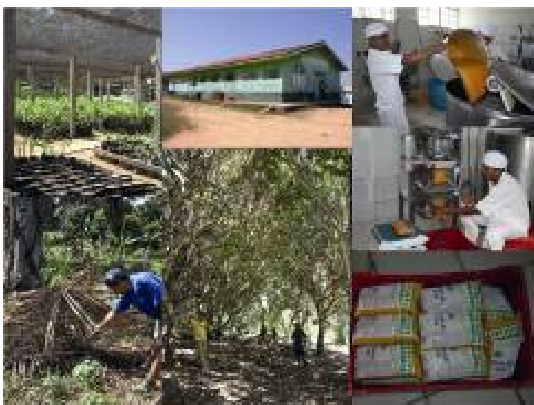
Figura 4: Da muda à polpa de fruta, processo de valorização das frutas na APA do Igarapé Gelado

de uma rede de cooperativas chamada FECAT 18 . Esta agrupa cerca de dez cooperativas concentradas na região do Araguaia-Tocantins. Ela já possui uma marca registrada no Ministério da Agricultura, Pecuária e Abastecimento (MAPA) e está solicitando um selo do tipo “indicação geográfica” (“frutos do Sudeste do Pará”). Este tipo de labelização, ainda pouco conhecido no Brasil 19 , inspira-se do modelo francês (DESPOBLINS, 2004), o qual foi explicitamente evocado durante nosso trabalho de campo pela agência local 20 realizando este processo para a COOPER (agosto 2007). Porém, ao contrário do que nos foi declarado, percebemos que o selo que a COOPER está tentando por em prática corresponde mais a uma IGP 21 do que a uma AOC 22 , o que demonstra da falta de experiência e de conhecimento no assunto. Mais do que uma relação específica do homem com a natureza ou a utilização de variedades locais, no caso da COOPER, trata-se de valorizar os saberes e as práticas dos agricultores da região. Pois certas variedades utilizadas são perfeitamente genéricas, tal como o açaí ( Euterpe oleracea ) e o cupuaçu ( Theobroma grandiflorum ), o exóticas, como o tamarindo ( Tamarindus Indica ).