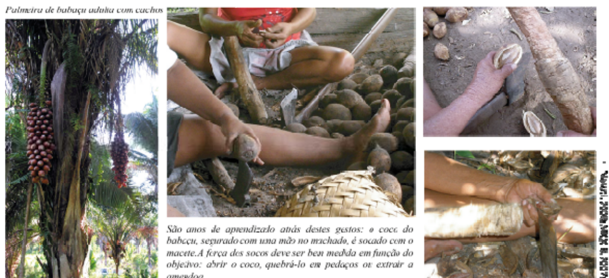
Figura 2: Palmeira de babaçu e técnica da quebra do coco

Verdadeira afirmação cultural das quebradeiras de coco, esta certificação informal expressa tanto a origem do recurso (unidade de conservação) quanto a identidade histórica (saberes tradicionais transmitidos de geração em geração). Além disto, ela beneficia da caução institucional do IBAMA, atestando uma produção em harmonia com a natureza, assim como do MIQCB, que afirma a identidade das produtoras.