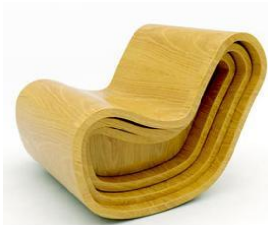
Figure 4.2. Le siège « Magic » de Roy Dripta

Les moyens employés pour trouver ces solutions sont redondants. Ils augmentent donc les chances des personnes d'identifier des solutions existantes. Ainsi, le résultat précédant de la « chaise vague » (figure 4.1) peut aussi être trouvé à l'aide de la table d'opération en hyperspectre. En effet, le croisement de l'Echelle de perception - orientation centrale et de l'Opération Translation - Action positive propose le verbe onduler. De même, le « siège Magic » peut tout aussi bien être le fruit d'une métaphore associée au monde