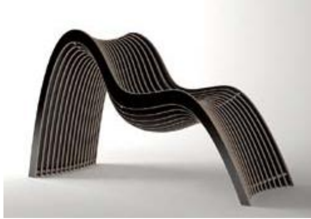
Figure 4.1. La « Nurb chair » d' Untothislast