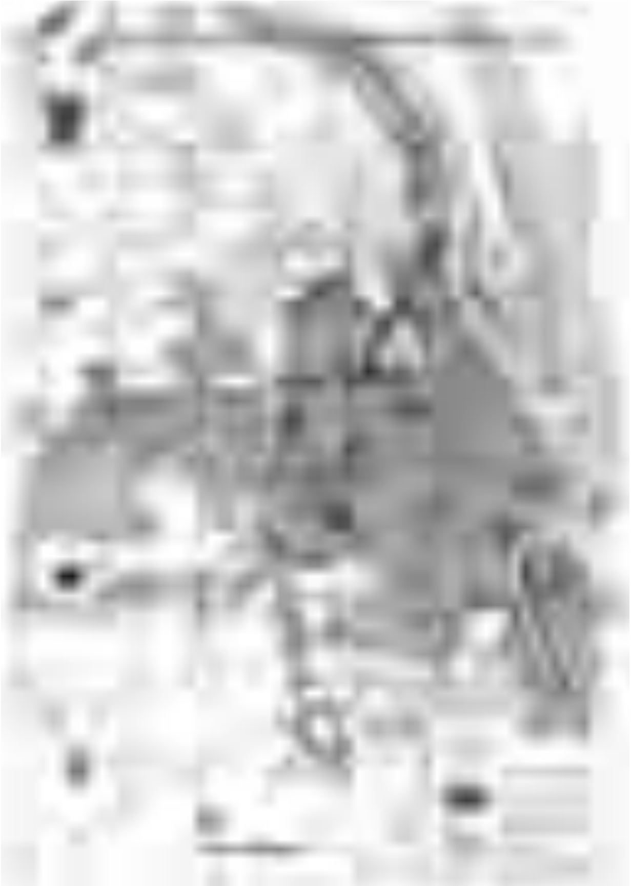
Carte des quartiers informels de Phnom Penh en 2005