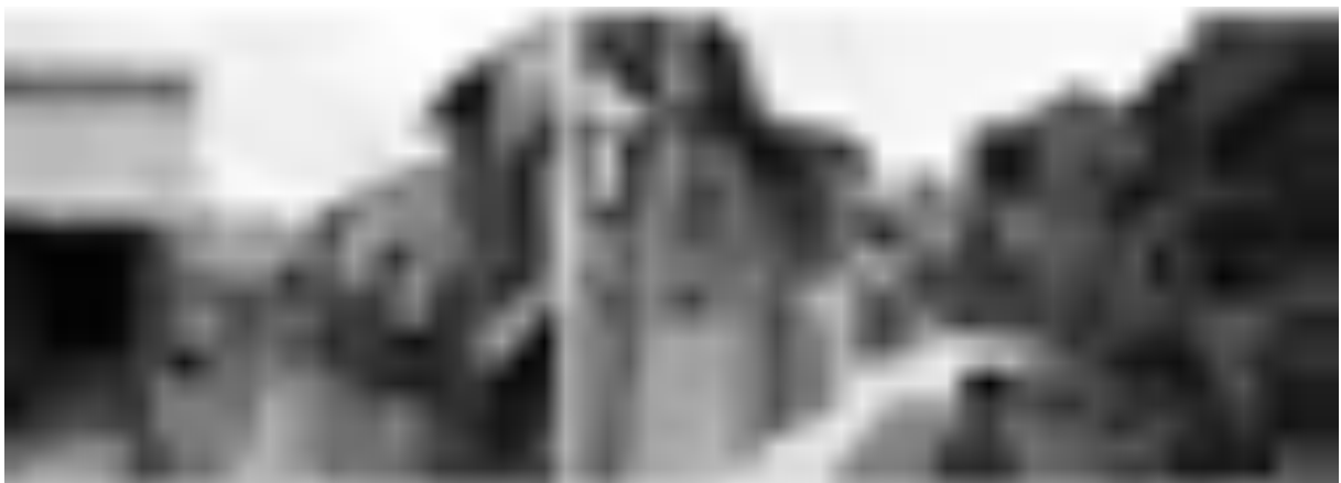
Les quartiers informels de Phnom Penh recèlent un large éventail de constructions, de la maison en paille (à gauche, quartier informel de Bassac au centre ville) à la maison en brique et bois à étage de type compartiment (à droite, quartier informel de Prek Tanou au sud).