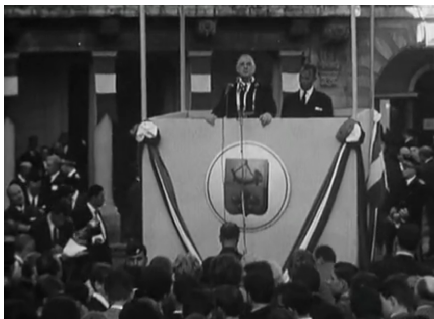
Illustration 1: De Gaulle sur une estrade démesurée vue aujourd'hui

Éléments figuratifs: Juxtaposition d'images de la foule et d'images de de Gaulle