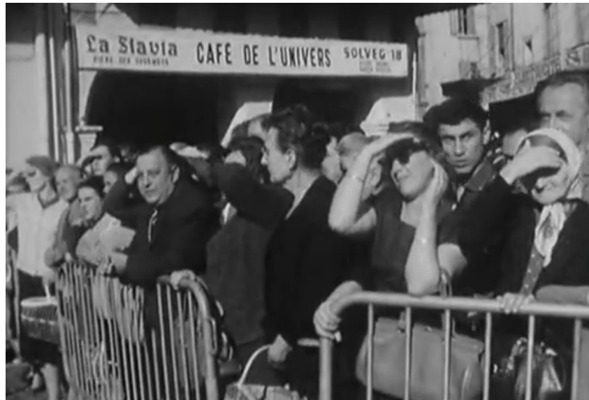
Illustration 2: Contre champ de la foule