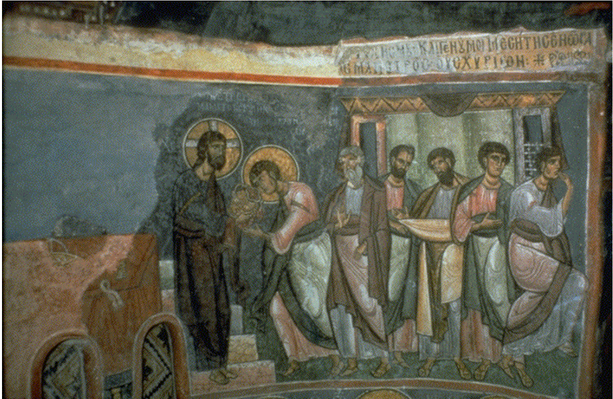
Figure 1 : Eglise Panagia Phorbiotissa d'Asinou, Chypre (1105-1106), détail de la Communion des Apôtres

personnage, vers lequel le Christ et certains apôtres dirigent leur regard, ne peut être que Judas qui s'éloigne en recrachant le pain.