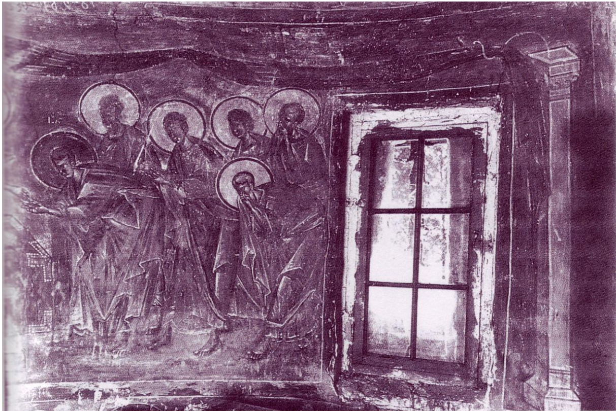
Figure 4 : Communion des Apôtres , l'Église de la Dormition à Volotovo (Novgorod) (XV e siècle).

Pendant la période post-byzantine, dans les églises de saint Nicolas à Moschopole (1721-1750) et des Saints apôtres Pierre et Paul près de Vithkuqi (1708-1764) en Albanie, 27 Judas apparaît sur l'extrême gauche de la Communion d'Apôtres , s'éloignant avec un démon sur son épaule qui chuchote dans son oreille. Ce motif de Judas avec le diable dans la Communion des Apôtres est très rare. 28 Il apparaît encore dans le Monastère de Varlaam des Météores (1566), dans le catholicon du Monastère Gregoriou au Mont Athos (1779) et dans l'Église du monastère de Saint-Naum à Ohrid en Macédoine (1806). 29