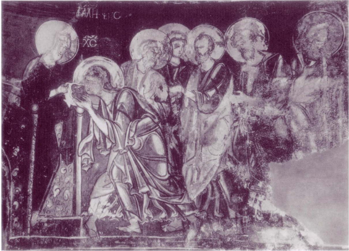
Figure 2 : Détail de la Communion des Apôtres , (Métalipsis), Saints Apôtres Pérachorio, Chypre (1170).

Dans la composition de la Communion des Apôtres à Saint-Clément d'Ohrid 22 en Macédoine (vers 1295), Judas nimbé ( sic ), en tête du groupe des Apôtres à droite, a la bouche ouverte et même ses dents sont représentées ! Une autre caractéristique iconographique est la représentation de Judas de profil, ce qui dans le langage des peintres et zoographes de l'Église signifie un personnage négatif. Judas a pris la place d' « honneur », un élément qu'on peut rencontrer parfois dans la représentation de la Cène. D'après G. Millet, 23 se référant au texte de Chrysostome, 24 cette place d' « honneur » s'explique par la volonté du peintre de montrer l'impudence de Judas, qui a pris à la Cène une place plus haute que le premier des apôtres lui-même. C'est probablement la même raison qui a motivé les célèbres peintres Michel Astrapas