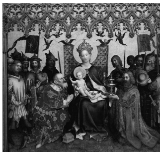
1. Stefan Lochner, Dombild ou Retable de l'adoration des mages (cathédrale de Cologne).

d'ailleurs à l'origine d'un débat célèbre et déjà ancien sur l'identité de Stefan Lochner qu'illustre parfaitement la confrontation des positions de Julien Chapuis et Brigitte Corley : faut-il identifier l'auteur du retable de l'Adoration des mages (le Dombild , fig. 1), réalisé pour la Ratskapell de la ville et conservé à la cathédrale de Cologne depuis 1908, avec le " Maister Steffan zu Cöln " que Dürer admire au point de payer deux pfennigs d'argent pour faire ouvrir son retable lors de son passage dans la ville en 1520 ? Et faut-il également reconnaître, dans ce « maître Stefan », l'une des rares personnalités documentées pour la période, le peintre Stefan Lochner, établi à Cologne vers 1435 et mort dans la ville en 1451 ? Brigitte Corley s'y refuse et parle prudemment du « maître du Dombild », trop prudemment, pourrait-on dire, au regard du faisceau convergent d'indices rassemblés par Julien Chapuis en faveur de l'hypothèse Lochner.