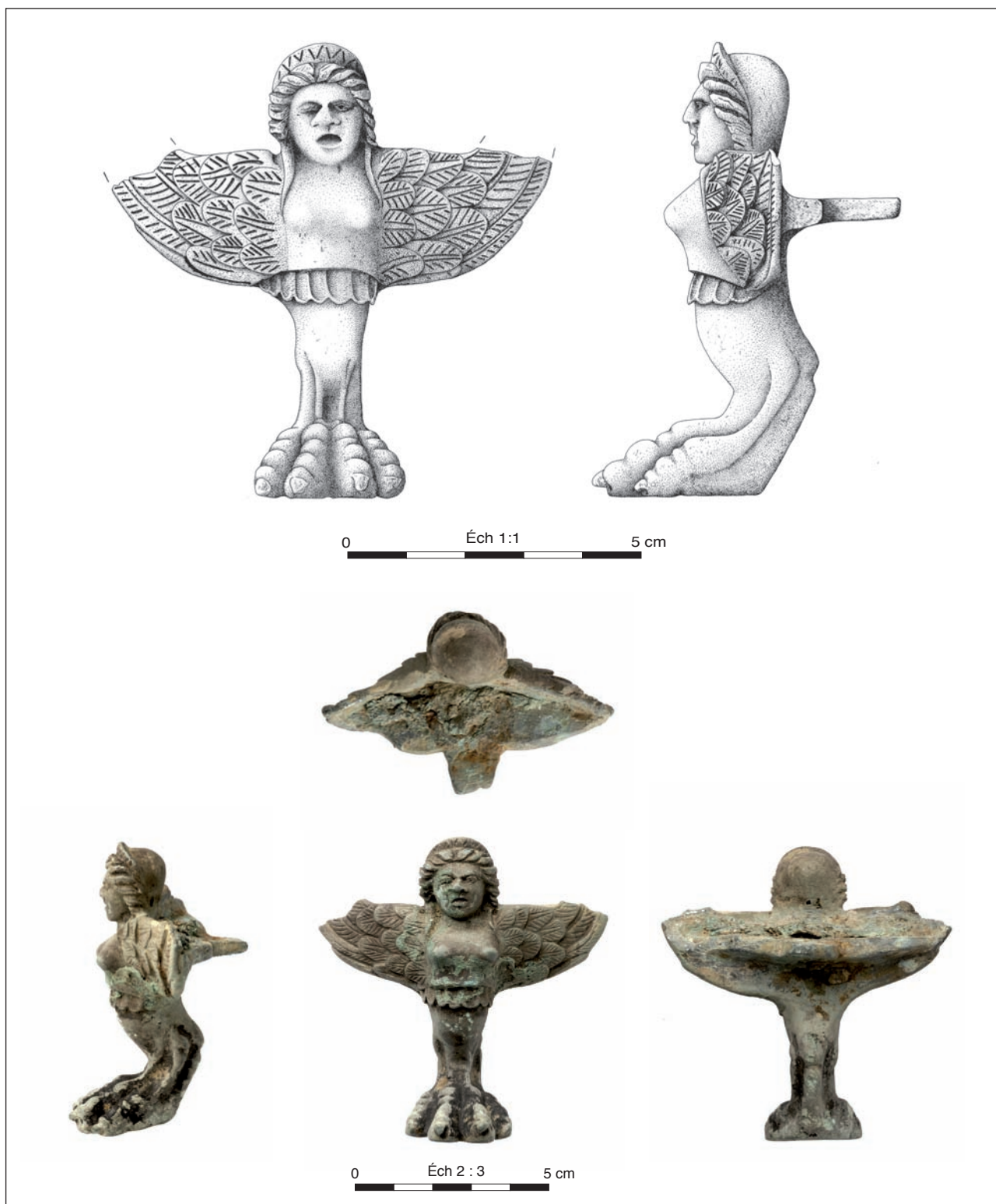
Pl. 1. Dessin (J. Gelot, INRAP) et clichés (A. Mailler, Bibracte) de la sphinge découverte à Fragnes.

Une statuette en bronze découverte à Pompéi, représentant la déesse Fortune assise, offre un intéressant parallèle (pl. 2, n° 2). Elle a les pieds qui reposent sur un petit marchepied dont les supports sont des sphinges. Un pied en forme de sphinge,