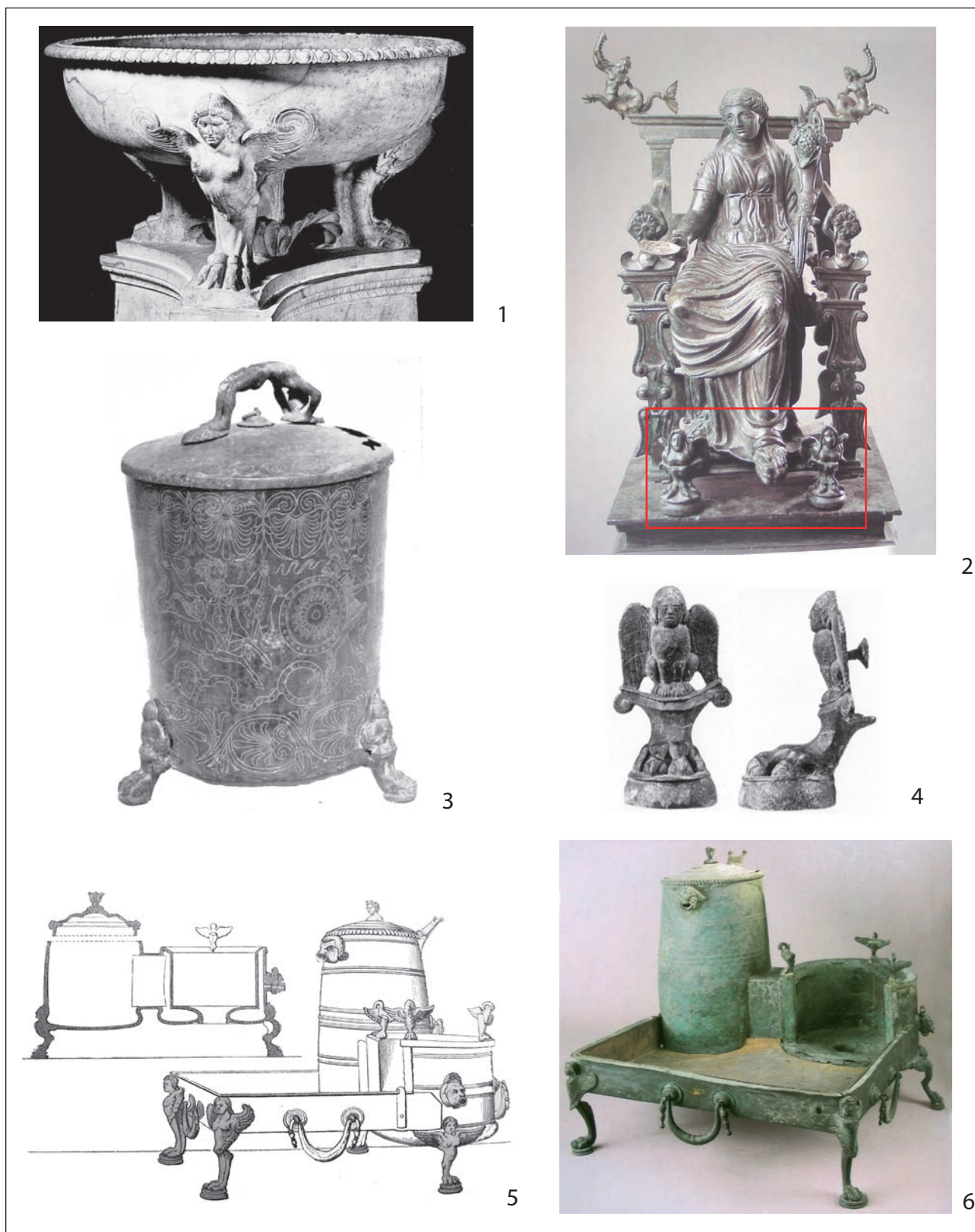
Pl. 2. Éléments de comparaisons : 1. d'ap. SAURON, 2000, p. 141 ; 2. d'ap. MARTIN PRUVOT, 2007, fig. 229 ; 3. d'ap. BOUCHER, 1970, p. 144 ; 4. d'ap. ADAM, 1984, p. 33-34 ; 5. d'ap. BARRÉ, 1840, fig. 67 ; 6. d'ap. www.espr-archeologia.it/articles/111/choreography-of-the-ancient-banquets .