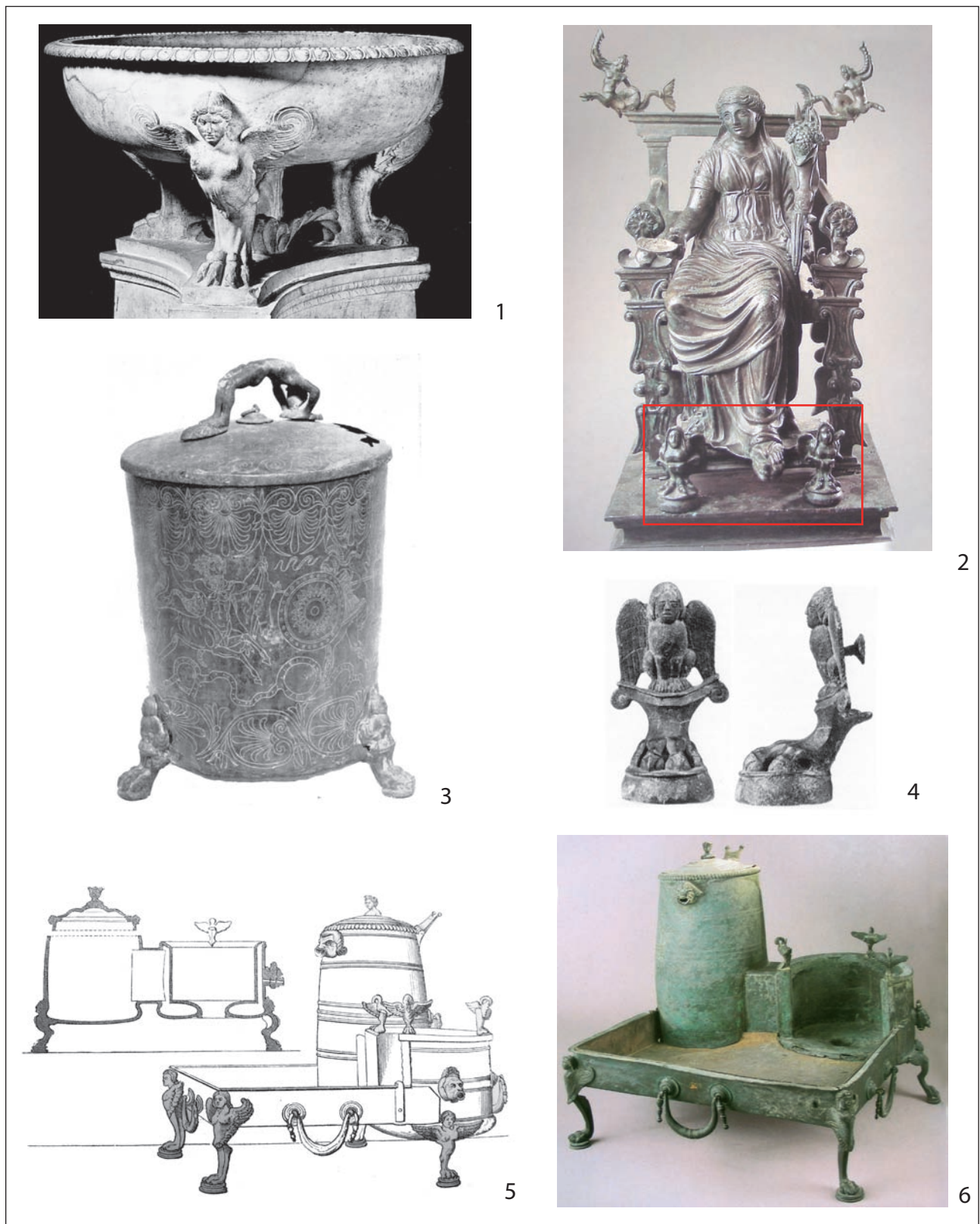
Pl. 2. Éléments de comparaisons : 1. d'ap. SAURON, 2000, p. 141 ; 2. d'ap. MARTIN PRUVOT, 2007, fig. 229 ; 3. d'ap. BOUCHER, 1970, p. 144 ; 4. d'ap. ADAM, 1984, p. 33-34 ; 5. d'ap. BARRÉ, 1840, fig. 67 ; 6. d'ap. www.espr-archeologia.it/articles/111/choreography-of-the-ancient-banquets .