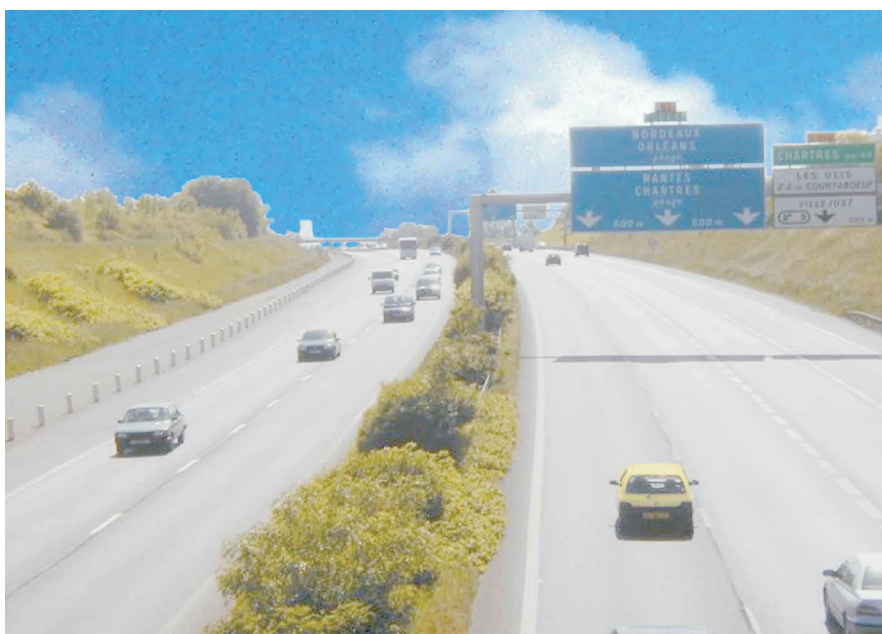
La voiture est davantage utilisée par les internautes (58 %, vs 44 % des déplacements dans l'enquête standard).

La voiture est davantage utilisée par les internautes (58 %, vs 44 % des déplacements dans l'enquête standard).