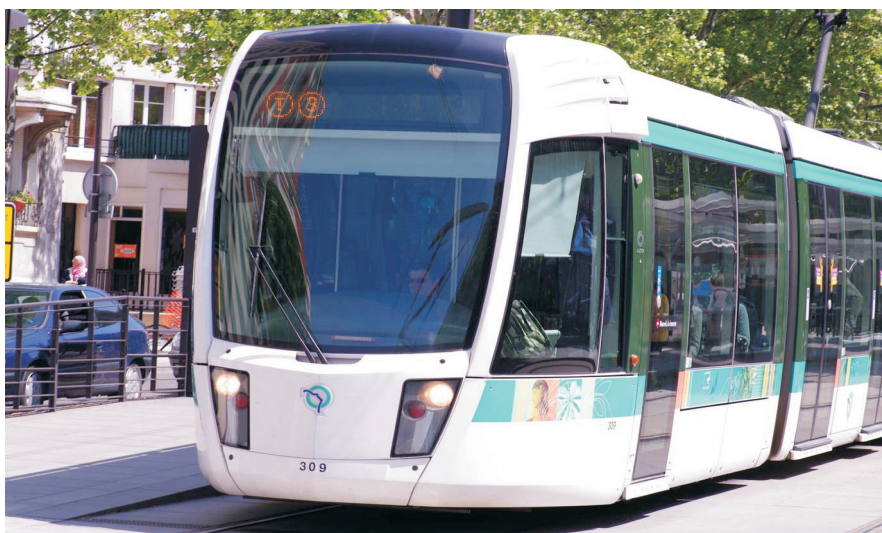
Connaître avec précision les pratiques des habitants est nécessaire pour assurer le développement durable des infrastructures et des politiques de déplacement.

Les taux de réponse des enquêtes Transports classiques tendent à décroître dans le temps. Cette propension à la non-réponse diminue la confiance que l'on peut accorder aux résultats des enquêtes en termes de représentativité de la population étudiée. De nombreuses techniques, comme l'information préalable et la réduction de la lassitude des répon-