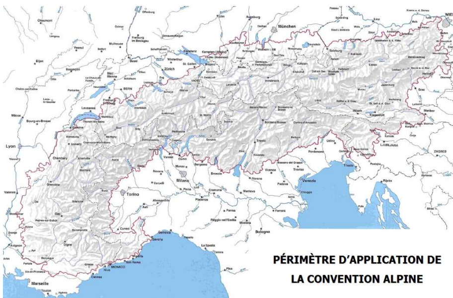
Figure 2 : L'espace de la Convention alpine