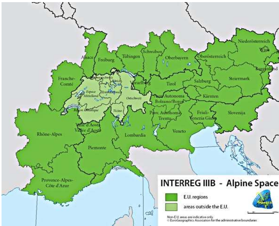
Figure 1 : L'espace alpin des initiatives Interreg