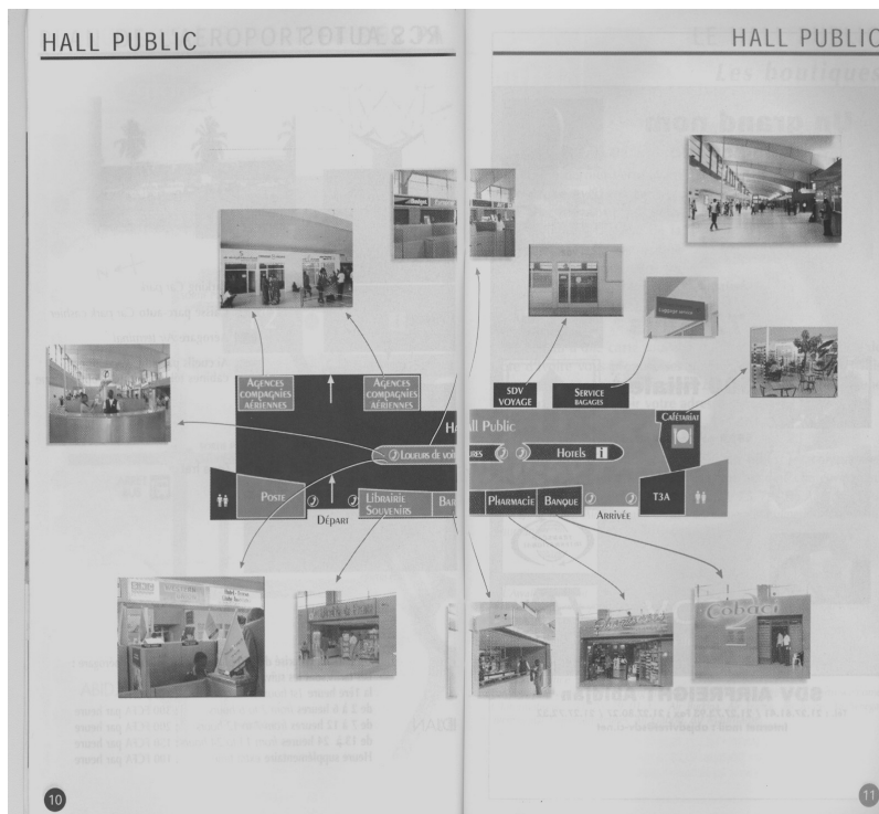
Photo2 : Plan de structure et différentes zones d'activités de l'aéroport Cliché AERIA, 2010

Développé à la faveur de sa modernisation et privatisation en 1996, le commerce à l'aéroport d'Abidjan connaît un dynamisme surtout au cours de cette dernière décennie. Persuader de l'extraordinaire rentabilité économique des commerces au sein des aéroports, les autorités gestionnaires de celui d'Abidjan y ont multiplié les enseignes, encouragé les investissements pour diversifier leurs revenus. Ces revenus portent sur divers domaines : location de voitures, parkings, vente de téléphones portables et accessoires, revenus fonciers et immobiliers, concessions commerciales dans l'environnement aéroportuaire. Pourtant l'exercice de l'activité commerciale n'est pas un phénomène nouveau au sein de l'aéroport. Pendant longtemps, cette infrastructure de transport s'est dotée d'espaces viaires pour la pratique du commerce. Il s'agit d'espace duty-free situé en zone sécurisée. L'offre de cette zone s'était cantonnée à la presse, à la restauration, aux enseignes pour souvenirs et produits de luxe, à l'alcool et au tabac. Par la suite, cette gamme de produits s'est élargie de façon qualitative pour s'ouvrir au textile, à l'électronique, à l'horlogerie et à la mode. Aujourd'hui, le commerce a même débordé de la zone sécurisée pour gagner la zone publique où les galeries marchandes se sont multipliées (voir photo2).