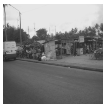
Photo : marché du fret, situé juste en face de l'aérogare fret (Cliché, Meh Anastasie, 21/04/2010)

L'effervescence commerciale observée au sein de la frontière-aéroport affecte en premier lieu les alentours de l'aéroport qui bénéficient d'une rente de situation de l'entremêlement de plusieurs frontières sur cet espace réduit. Ce pourtour aéroportuaire est en contact de plusieurs zones monétaires grâce aux liaisons aériennes directes ou non avec des pays de l'ensemble du globe et la Côte d'Ivoire. A l'image des frontières terrestres, le bouillonnement d'activités commerciales a comme incidence spatiale, l'apparition ou le développement de marché de proximité (voir photo 3).