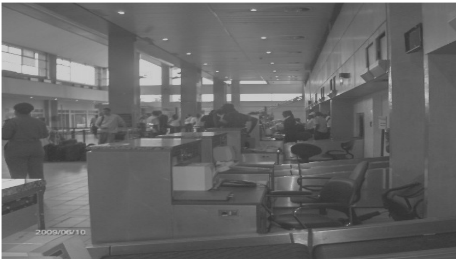
Photo 1 : Une vue des installations de la salle d'enregistrement

temps limité à travers la compagnie nationale Air Ivoire . Plusieurs fois par jour, plus d'une dizaine de vols et de 3750 passagers quotidiens « dans un système de convergence-divergence » (Madoré, 2006) met ébullition l'ensemble des acteurs de cet espace. Ainsi, en rapport avec cette politique, la massification ou la densification des flux dans cet terminal, s'est-elle accompagnée d'innovations pour les passagers et le fret. Pour ce faire, les autorités gestionnaires de cet aéroport (AREA) 2 y ont développé de nouvelles installations en matières de sécurité mais également pour permettre aux usagers de se divertir et travailler pendant leur temps d'escale et de transit. Eu égard à cela, l'aérogare (25000m 2 ) conçu pour accueillir 2 millions de passagers, dispose d'une salle d'attente avec wifi, une organisation facilitant la récupération des bagages et l'accès à la salle d'embarquement (3000m 2 ), plusieurs écrans téléviseurs distillant des informations en temps réels sur l'ensemble des vols et un service de bagagistes professionnels. Les banques d'enregistrement ont été portées à 25 au lieu 3 au départ, disposées dans une salle de 1200 m 2 et munie chacune du système CUTE 3 , un tapis roulant pour les bagages a été installé (voir photo1)