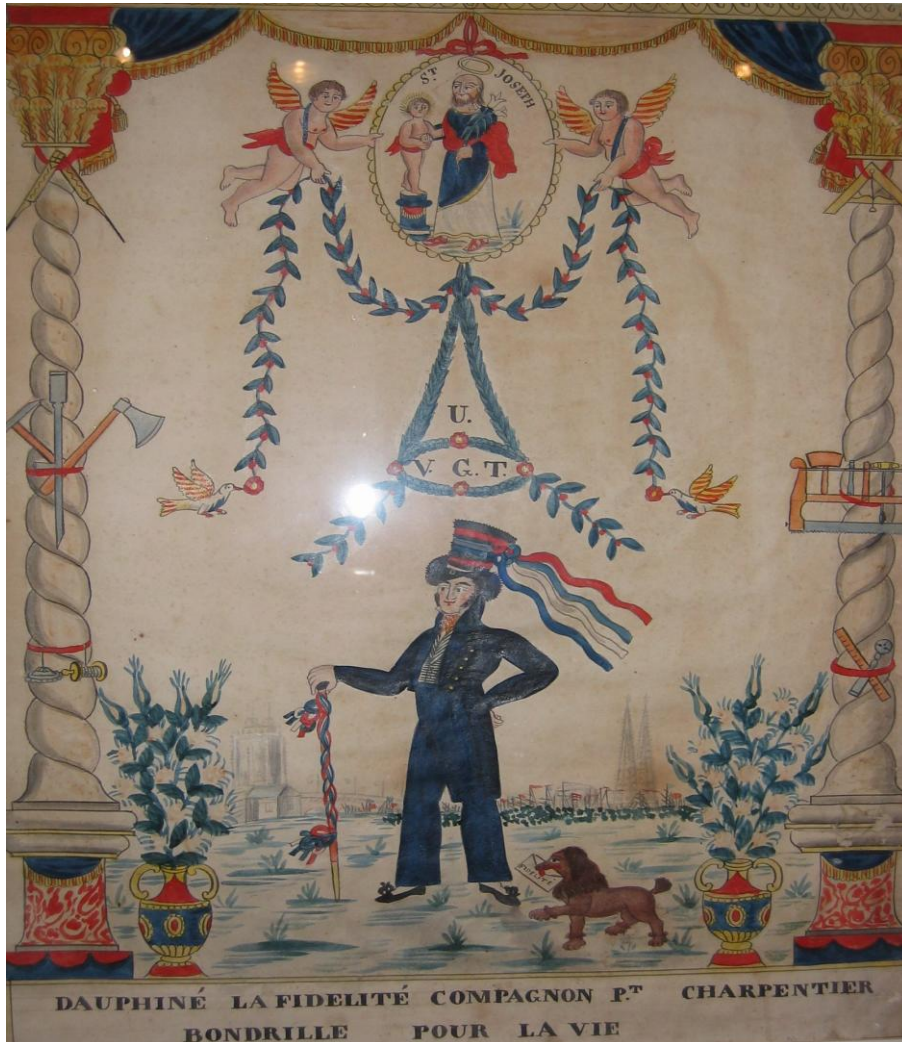
Souvenir du Tour de France de Dauphiné la Fidélité, compagnon passant charpentier (dessin à la plume rehaussé d'aquarelle et de gouache). Fait par Leclair, vers 1830. Musée du compagnonnage, Tours.

Les charpentiers et les couvreurs du Devoir sont parmi ceux qui sont le plus explicites, rappelant dans les légendes et textes qui accompagnent ces tableaux que le compagnon à qui on les remet est « bondrille pour la vie ».