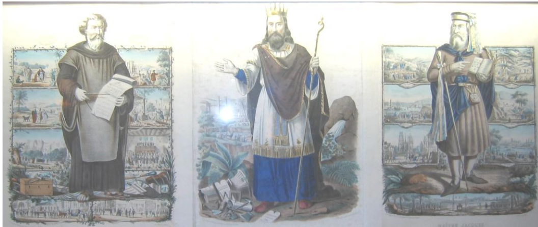
Les Pères fondateurs : le père Soubise, le roi Salomon et maître Jacques.

Ces « inventions » ont assis des rivalités qui, une fois de plus, évoquent davantage les pratiques des jeunesses rurales que celles des corporations d'Ancien Régime. On se bat pour défendre les noms de Jacques ou de Salomon, certes. Mais ces bannières ne sont exposées que tardivement : elles tentent de légitimer un combat dont les raisons « initiatiques » échappent de plus en plus à la Raison. En effet, le défi, la compétition sont des données qui appartiennent en propre aux façons de faire les hommes 40 . Et les compagnons ont donné à ce point, qui peut être souvent symbolique, un aspect pour le moins concret.