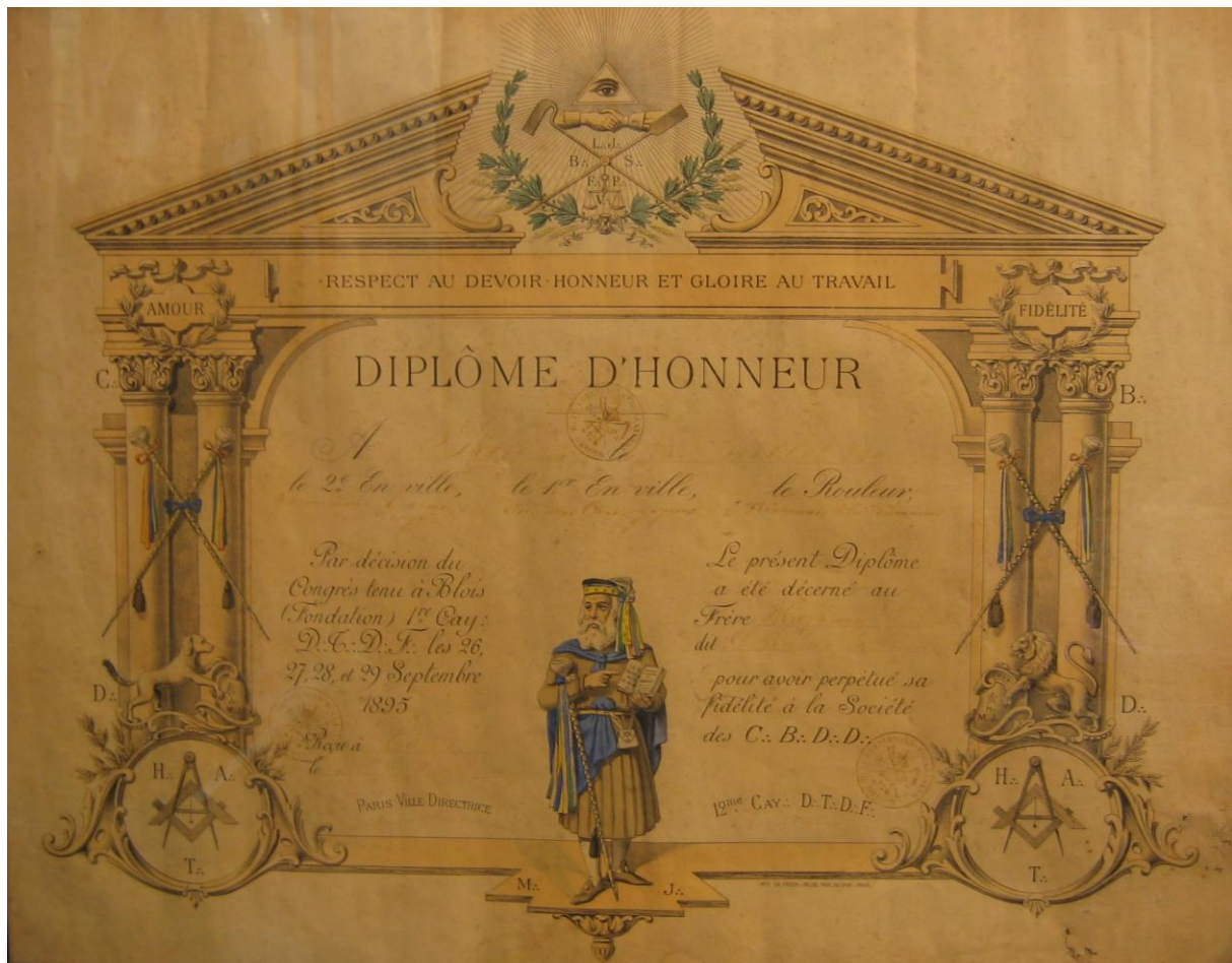
Diplôme d'honneur d'un boulanger du Devoir, 1895. Musée du compagnonnage, Tours.

Ce développement du souvenir, qui semble atteindre son apogée au milieu du XIX e siècle, n'efface cependant pas entièrement les désirs d'hommes qui n'étaient peut-être pas tous enclins à porter leurs pas dans la direction que le compagnonnage leur indiquait. Le « diplôme d'honneur » ci-contre le rappelle bien dans sa formulation. Celui-ci a été décerné à un boulanger « pour avoir perpétué sa fidélité à la Société ». Signe que cette attitude n'était pas systématique.