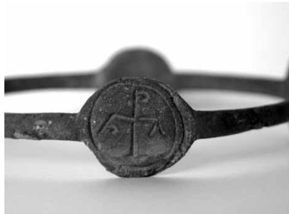
Figure 5. Croix chrismée © J. A. 2007.