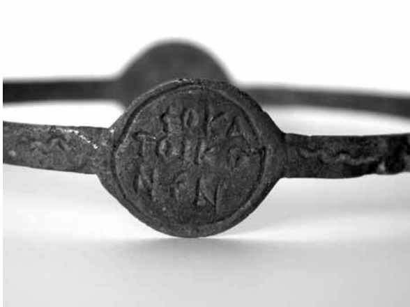
Figure 4. Début du psaume 90 © J. A. 2007.