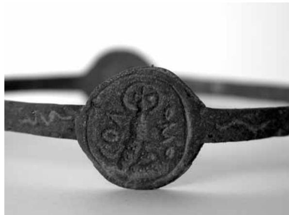
Figure 3. Invocation au nom de Salomon © J. A. 2007.