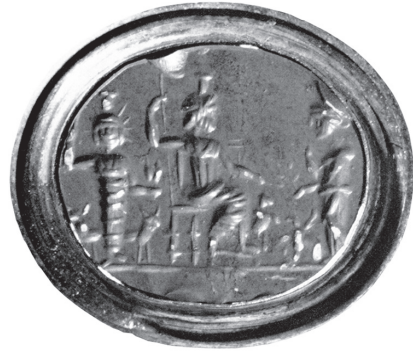
Fig. 13 – Intaille de jaspe rouge, British Museum : Jupiter héliopolitain engaîné et radié, à gauche de Sérapis trônant et de Némésis debout.

En ce qui concerne Bacchus, il semble probable que ce dieu soit accueilli à Baalbek comme à Béryte. Plusieurs témoignages illustrent la floraison de son culte à Béryte. Dans l'hymne où il énumère les divinités poliades (Hermès, Aphrodite et son cortège, Artémis, les Néréides, Zeus, Arès, les Grâces, la nymphe Béroé), Nonnos de Panopolis désigne la ville comme le « délicieux séjour