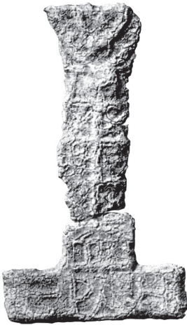
Fig. 1 – Plomb votif d'Ain el-Jouj, Staatliche Museen de Berlin. Photo Triade 1-2, n° 117, pl. 36.