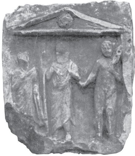
Fig. 15 – Monument funéraire de Baalbek, avec Hermès psychopompe.

Dieu du passage, Hermès escorte enfin les Syriens sur le chemin des enfers. Les monuments qui le présentent dans un contexte funèbre sont nombreux