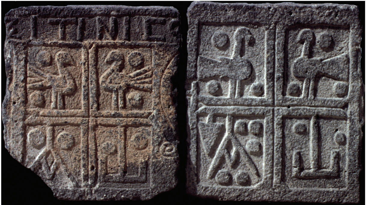
Portes de tombeaux de Syrie du Nord (Musée de Damas).