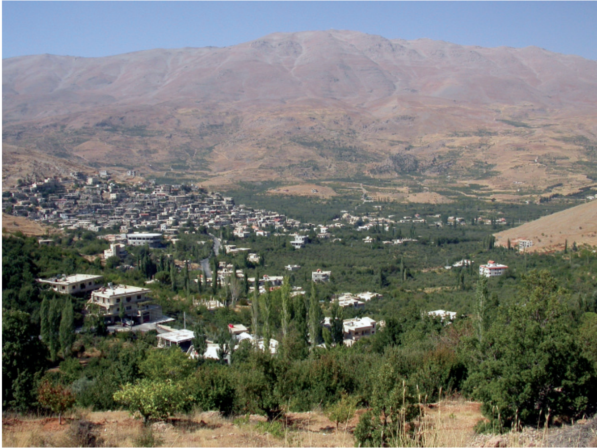
Vue de l'Hermon depuis Arné