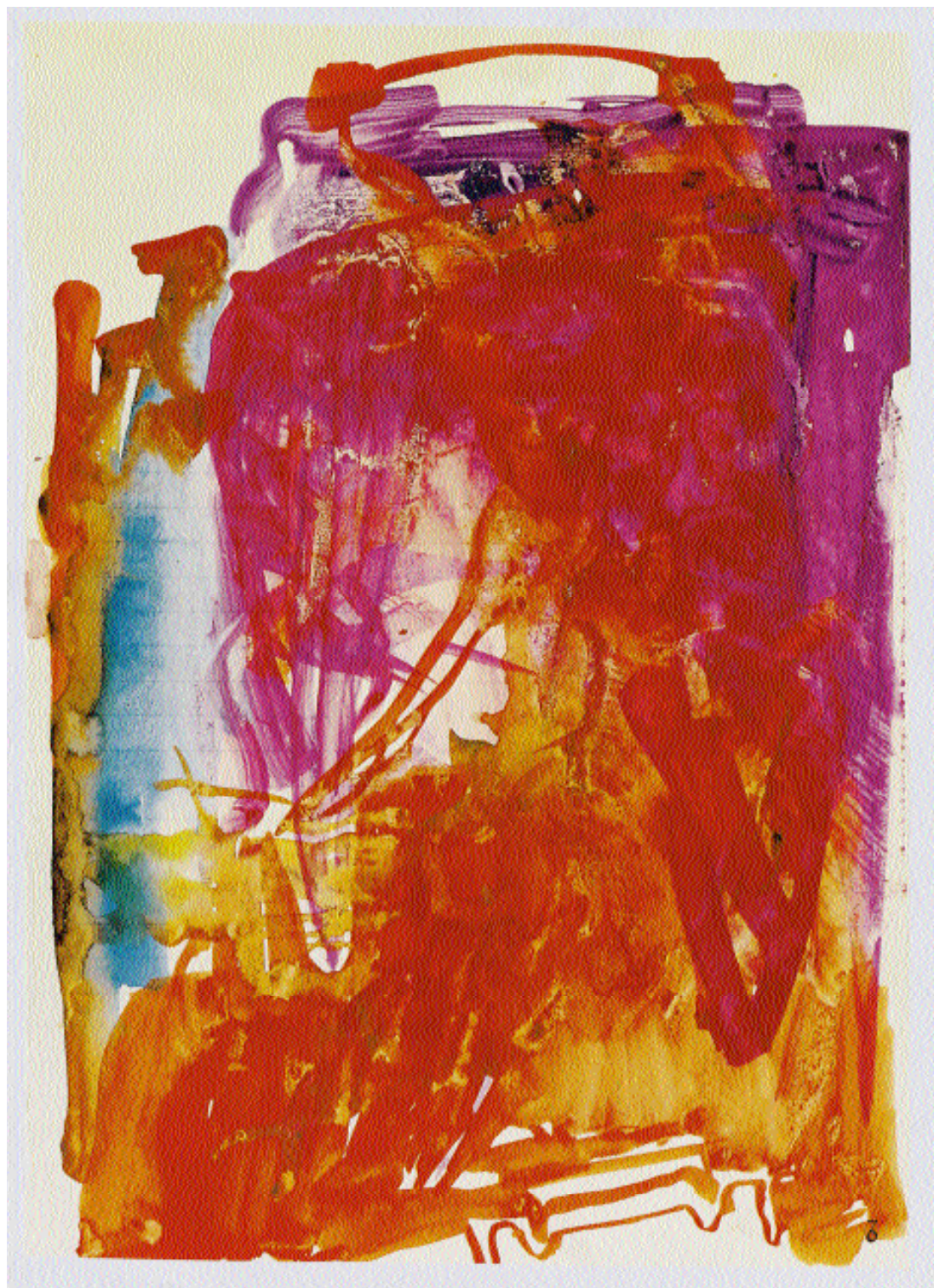
Fig. 1 Accumulator ( Enthladung ), 1959, gouache, 29,5 x 21,4 cm (Joseph Beuys, Natur, Materie, Form , Munich, Schirmer-Mosel, 1991: pl. 159)