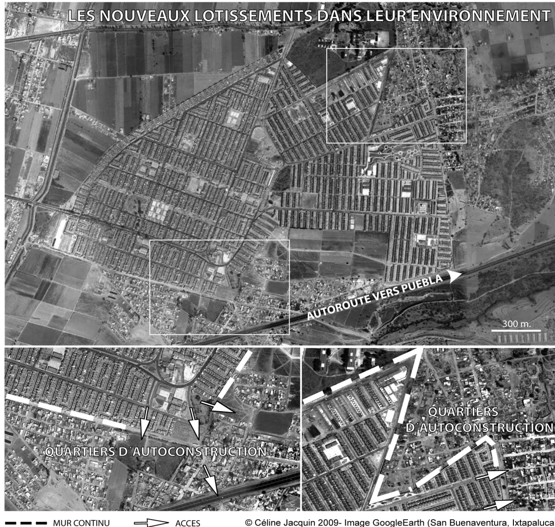
Figure 1 : Tracés et interruptions de la frontière dans le lotissement de San Buenaventura

Les habitants du lotissement sont pourtant, au sujet de la fermeture, les auteurs d'un discours contradictoire. Aucune occasion n'est négligée pour blâmer le développeur, escroc et rival dans leur processus d'ascension sociale, symbolisée entre autre par la fermeture périmétrale. Un sentiment d'inquiétude émerge en effet au contact d'une population considérée « d'un autre niveau » : celle de quartiers d'autoconstruction voisins, similaires à ceux dont proviennent par ailleurs une grande partie d'entre eux. Cette proximité inspire un sentiment d'insécurité 5 et la peur d'une dévaluation immobilière sur l'ensemble du lotissement. Les actes de vandalisme dans l'espace public résidentiel, encouragés selon les habitants par les accès restés ouverts, mais aussi la simple intrusion d'un décor de pauvreté dans le paysage « harmonieux » et « propre » de leur lotissement, vont à l'encontre du discours du promoteur. Celui-ci garantissait une plus-value immobilière rapide, en relativisant l'inconfort initial du lotissement -lié à une infrastructure municipale encore sous-développée et aux services irréguliers-, par un pari sur l'avenir : la densification des municipalités du fait de l'accumulation des opérations de logement social inciterait progressivement l'investissement municipal, régional et privé dans l'infrastructure collective et commerciale. Dans ce calcul, la