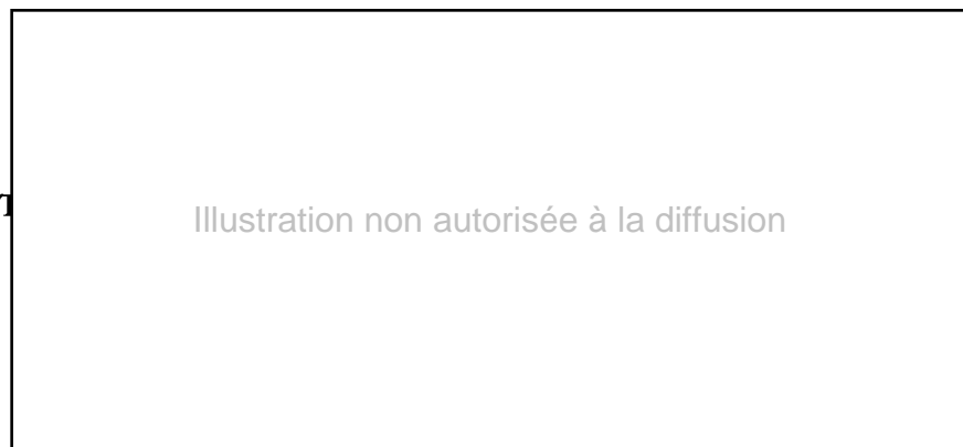
Illustration non autorisée à la diffusion