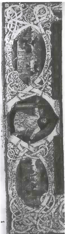
Fig. 3. Augustin entre les deux cités (détail de la bordure inférieure). AUGUSTIN, De civitate Dei , prologue. Città del Vaticano. Bibliothèque apostolique vaticane, Burghes 366, f° 1 r (enluminé par Giuliano Amedei peut-être à Rome en 1462). Extrait de S. MADDALO, In figura Romae: immagini di Roma nel libro medioevale , Rome, Viella, 1990.

Si l'on en revient aux performances qu'on a identifiées dans l' Allegoria , la première est accomplie par ce tableau en tant qu'objet. Au xv e siècle l'exigence de consacrer à Dante un monument funéraire à Florence était pressante. Le sépulcre n'étant pas faisable à cause de l'absence du corps qu'il aurait dû abriter. Le tableau dans sa matérialité vient le remplacer dans la cathédrale. Dans sa matérialité... même si on pouvait avoir recours à d'autres objets non imagés mais équivalents sous le profil fonctionnel (une chandelle comme on en allume encore à la mémoire des morts), la matérialité du tableau le rend préférable du fait de sa dialectique de proximité (il s'agit d'un objet non éphémère) et de différence (il est peint et non sculpté) avec l'objet qu'il allait remplacer et faire oublier (le sépulcre et le corps). Il est à remarquer que ce choix se donne à l'intérieur d'une dynamique doublement conflictuelle, conflit entre la Commune de Florence et la ville de Ravenne qui refuse de restituer le corps de Dante, et conflit entre la Commune et les Florentins qui réclament depuis longtemps le sépulcre. Le choix de l' Allegoria alors en tant qu'image-objet 23 , en ce cas funéraire, vient réaffirmer l' aucloritas de la Commune dans deux conflits qui la voyaient dangereusement réduite à l'impuissance.