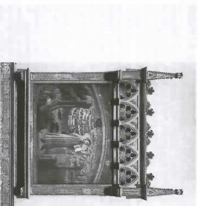
Fig. 1. DOMENICO DI MICHELINO, Allegoria della Commedia (1465). Florence, Santa Maria del Fiore.

la notion médiévale d' imago , qui est avant tout une re-présentation 6 , et au mythe de la ressemblance dont Georges Didi-Huberman a montré les racines et les enjeux chez Vasari 7 . Sous l'angle de l'anthropologie historique des images, l' Allegoria apparaît alors comme à cheval sur deux systèmes, destinés à s'éloigner, mais dont elle montre une fois de plus la continuité souterraine. Dans chaque cas, le lien entre l'activité imagière et la mort l'emporte. Dans ce cadre général, pour saisir la spécificité de l' Allegoria il faut connaître l'histoire à laquelle cette imago répond. La problématique funéraire implicite dans la production imagière médiévale et renaissante fait ressortir le premier problème posé par l'« affaire Dante » aux Florentins. Dante est mort à Ravenne en 1321, où il vivait depuis cinq ans sous la protection de Guido Novello da Polenta. Son sépulture y est encore visible aujourd'hui bien que remanié plusieurs fois. Or, à partir de la seconde moitié du XIV e siècle notamment, les intellectuels florentins plaident à maintes reprises en faveur du transfert de son corps. Les tentatives faites par la Commune, pourtant, n'ont guère de succès et la question demeure au XV e siècle (et pour longtemps par la suite) un scandale public, dont la Commune est blâmée certes