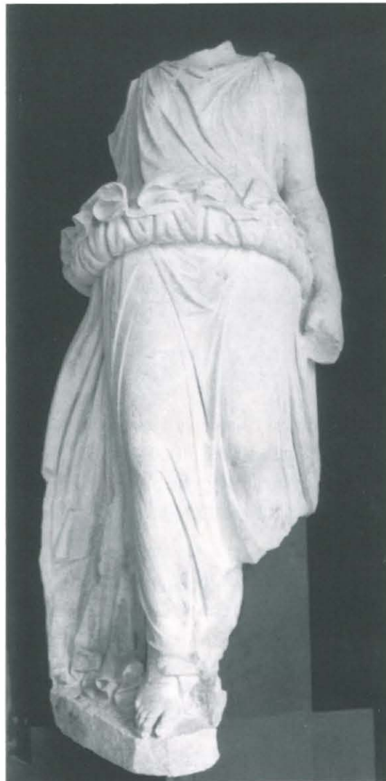
○ Fig. 2. Nymphe acéphale inv. 958-2-6.