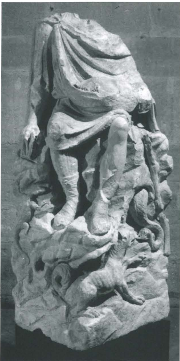
○ Fig. 5. Berger inv. 958-2-1 (Cl. Musée archéologique de Nîmes, nég. 10451).

La statue masculine acéphale, de dimensions naturelles, représente un homme drapé assis sur un rocher 16 . Placé en position frontale, le personnage a le bras droit baissé le long du corps avec la main tenant une syrinx et le bras gauche fléchi dont la main, aujourd'hui fragmentaire, devait tenir le pedum placé juste en dessous. L'homme est vêtu d'une tunique courte à manches et d'un manteau qui lui couvre le torse et attaché sur l'épaule droite par un cabochon. Des jambières couvrent les jambes tout en faisant bien ressortir l'anatomie musclée du personnage. Enfin, des chaussures aux semelles épaisses sont entièrement lacées jusqu'au bas des mollets où les liens dessinent un nœud d'Héraclès. Plusieurs animaux accompagnent le berger. L'un, dans un très mauvais état de conservation, est blotti dans son giron. Quelques traces de poils longs au niveau de la cuisse et de la queue et la forme générale suggèrent un chevreau. Sous les pieds du personnage, à sa gauche, sont placés un chien avec la queue en panache et qui laisse voir les crocs face à un serpent acéphale qui sort d'un trou pratiqué dans le rocher. Toujours sous les pieds du berger mais du côté droit se trouve un lézard. La face arrière, sculptée succinctement, présente le torse drapé du manteau et le rocher.