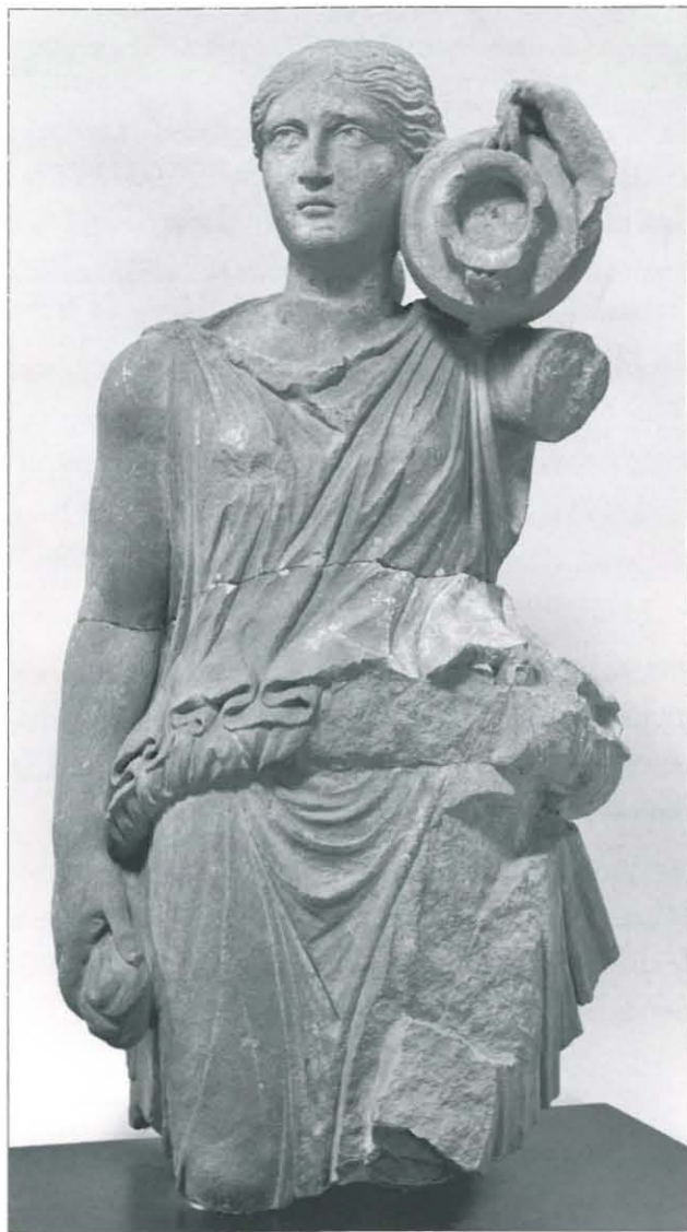
○ Fig. 1. Nymphe inv. 958-2-5 (Cl. A. Chéné, Ph. Foliot, CCJ, CNRS, Aix-en-Provence, nég. 144876).