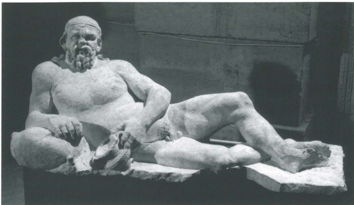
○ Fig. 3. Silène inv. 958-2-7 (Cl. Musée archéologique de Nîmes, nég. 10454).

De la seconde statue, il ne reste que deux fragments. Le premier est composé d'une partie des jambes et du bassin, l'ensemble en mauvais état de conservation 10 . Le second présente une partie du profil droit avec l'oreille animale et une mèche en anglaise de la barbe ; ce fragment, disparu aujourd'hui, est connu grâce à une photographie conservée dans les archives du Musée de Nîmes 11 .