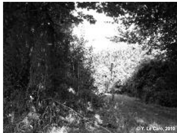
Figure 2 : Balise discrète et traces du pâturage