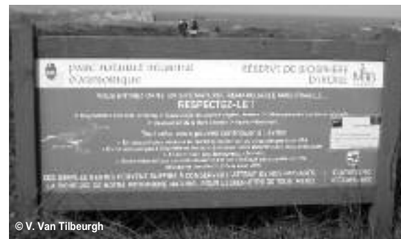
Figure 4 : Délimiter l'espace et y associer des normes d'usage

par exemple des caractéristiques de la biodiversité spécifique. Ce marquage correspond au balisage des chemins, aux poteaux indicateurs, aux cartes qui émaillent le cheminement des visiteurs et à tous les objets qui canalisent les visiteurs (barrières, sections de chemin recouvertes de bois, plates-formes d'observation). Un marquage complémentaire vient lui associer des normes de comportements. Il s'agit des panneaux autorisant ou interdisant certaines pratiques telles que la chasse, la pêche à pied, le camping, le canoë-kayak, ou rappelant les règles générales de comportement dans une nature construite comme sauvage (figure 4).