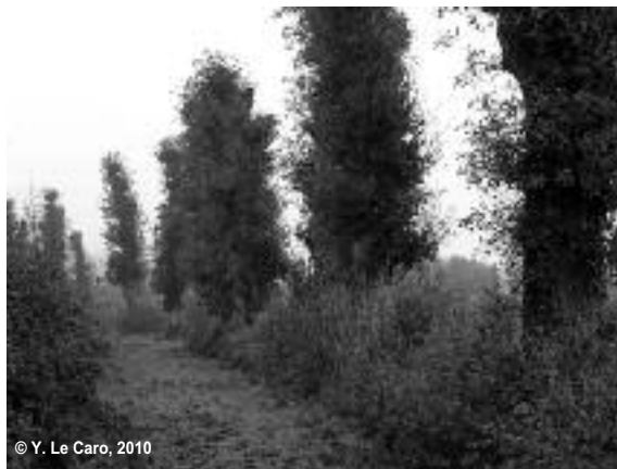
Figure 5 : Chênes émondés en ragosses (Bassin de Rennes)

Les usagers des loisirs marquent également l'espace par leurs pratiques, moins par les équipements fixes (huttes de chasseurs, passerelles de randonnée) que par leur présence physique : les tenues vestimentaires spécialisées (vestes de chasse ou de pêche, casque et bottes des cavaliers) et les attributs spécifiques de leur activité (cheval, fusil, canne à pêche, vélo, bâton) contri-