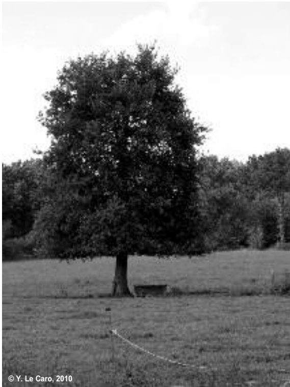
Figure 3 : Des traces du pâturage qui font marque ?

ses pratiques, l'observateur ne sait pas si le producteur de ces traces a eu l'intention qu'elles soient perceptibles et interprétables. A minima, en ne cherchant pas à effacer ses traces, leur producteur laisse cette possibilité d'interprétation ouverte. Dans certains cas, il pourra aller jusqu'à soutenir que ces traces indiquaient "à l'évidence" tel ou tel usage, telle ou telle appropriation. Par exemple, si un chien, non tenu en laisse, attaquait un bovin dans le pré de la figure 3, l'agriculteur pourrait probablement faire valoir que les traces du pâturage "valaient marque" et auraient dû engager le promeneur à rattacher son chien. Dans la suite du texte, le terme marquage sera donc entendu au sens large, c'est à dire en intégrant les marques et les traces sans préjuger de leur intentionnalité ni de leur intelligibilité.