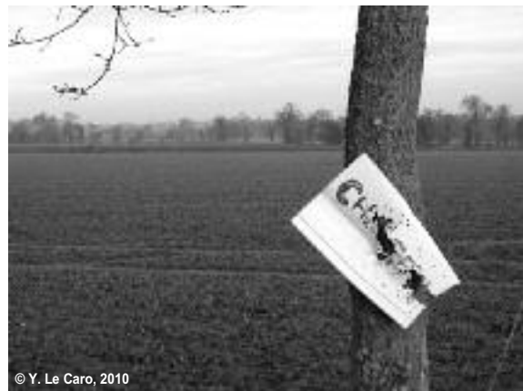
Figure 1 : Panonceau contesté ?

Les individus, les groupes et les institutions marquent l'espace pour affirmer le lien d'appropriation qu'ils y revendiquent, mais également comme forme d'ex-