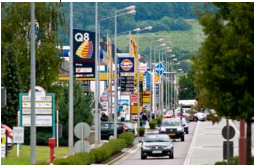
Allee der Tankstellen zwischen Mertert und Wasserbillig

In Europa spiegelt der Kraftstoffpreis nur zum Teil die Produktionskosten wider, da er durch die von Land zu Land unterschiedliche Höhe der Steuern bestimmt wird. In dieser Hinsicht hat Luxemburg es verstanden, einen Unterschied auszuspielen und dauerhaft Verbraucher aus den Nachbarstaaten anzuziehen. Die Kraftstoffpreise profitieren hier nämlich von einem zurückhaltenden Steuersystem, und zwar sowohl hinsichtlich der moderaten Mehrwertsteuern als auch der Mineralölsteuern. Diese Politik dient ebenso Unternehmen und Privatpersonen durch die Verfügbarkeit kostengünstiger Energie wie dem Großherzogtum, das auf diese Weise Einnahmen erzielt, die den Nachbarländern teilweise verloren gehen.