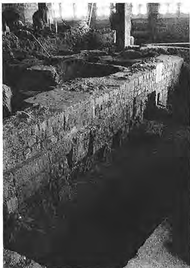
Fig. 2. Le Musée des Docks Romains en cours d'aménagement.