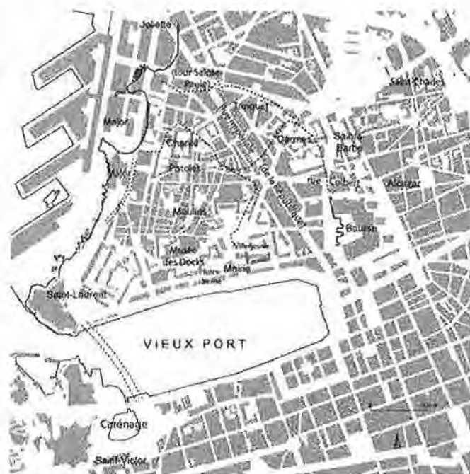
Fig. 1. Plan actuel de Marseille avec les principaux chantiers cités dans le texte ; le trait de côte antérieur au port de la Joliette est en noir soutenu, les différents tracés de l'enceinte en pointillé (Tréziny sur fond de plan Bouiron).

« Il y aura bientôt un quart de siècle (écrivait M. Euzennat en 1992) que les découvertes faites derrière le palais de la Bourse à l'occasion du creusement d'un parc de stationnement souterrain, en imposant l'ouverture de ce qui allait être en France le premier grand chantier d'archéologie urbaine, ont effacé l'image tenace de Marseille « ville antique sans antiquités ». Nous verrons plus loin ce que cette formule des années 1840, qu'on l'attribue à Lucien ou à Joseph Méry (Euzennat 1992, p. 66, n. 1), peut encore garder d'actualité, mais il est vrai que le début des fouilles de la Bourse en 1967 marque un tournant dans l'histoire de l'archéologie marseillaise. Je n'entrerai pas ici dans le détail des découvertes, que l'on trouvera exposées par le menu dans le récent volume de la Carte archéologique de la Gaule (2005), cité sous la forme CAG Marseille (Fig. 1). Le XIX e s. avait été l'époque des grands travaux d'urbanisme faits sans aucun souci du patrimoine archéologique (bassin de Carénage 1831-1832, rue Impériale 1861-1864, rue Colbert 1881-1884), jusqu'aux démolitions derrière la Bourse et la découverte du « mur de Crinas » (1913-1914). L'entre-deux-guerres est une période beaucoup plus calme, mais la destruction du quartier du Port en 1942 et la reconstruction de l'après-guerre entraînent des fouilles d'urgence faites dans des conditions difficiles, avec très