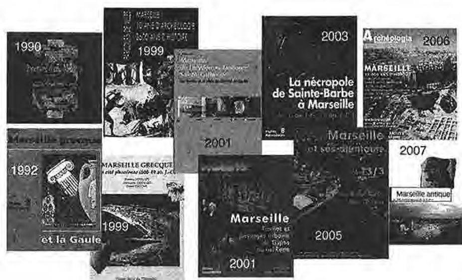
Fig. 5. Quelques publications récentes sur Marseille antique.