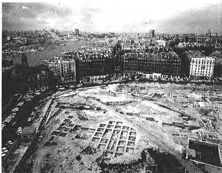
Fig. 3. Les fouilles de la Bourse : secteur méridional ( horrea d'époque impériale) et « carrés Wheeler ».

la construction du nouveau musée, beaucoup plus vaste, prévu à l'horizon 2013.