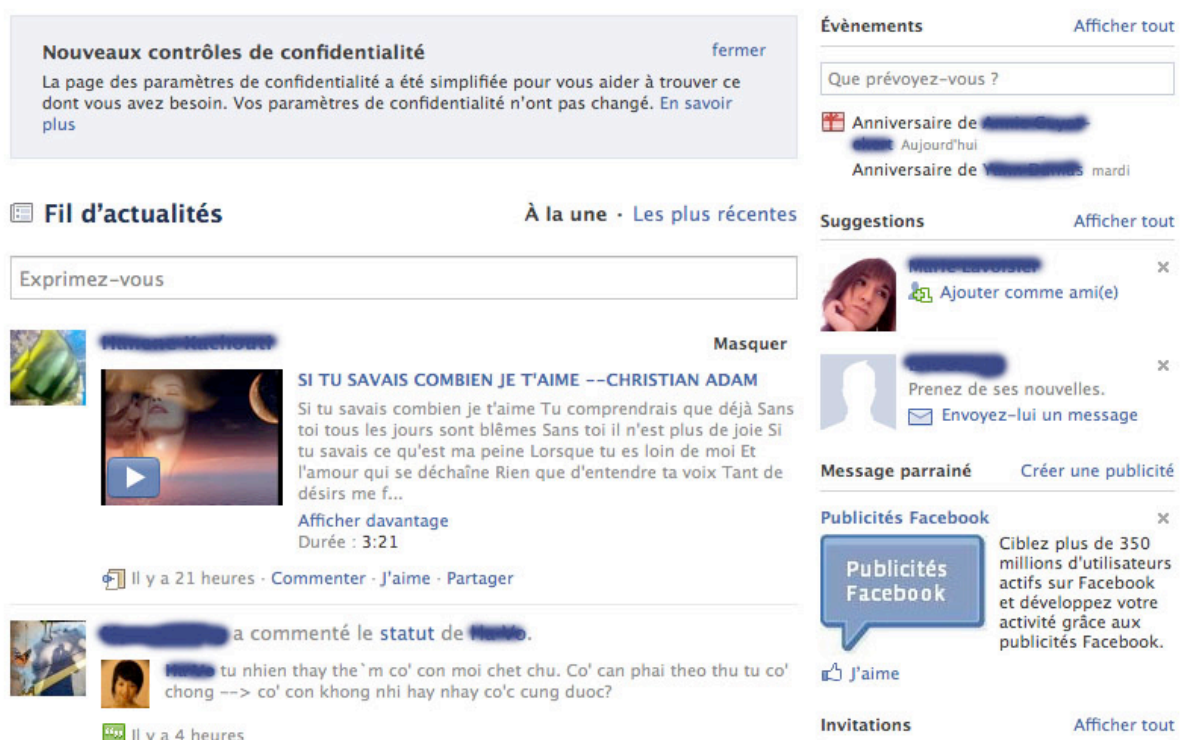
Figure 3 : Des dizaines d'interaction sur une seule page

Une fois dans le réseau, les interactions deviennent littérales, et le style prend une tournure caractéristique comme dans la Figure 4. On entre dans des rites d'interactions au sens de Goffmann (1974).