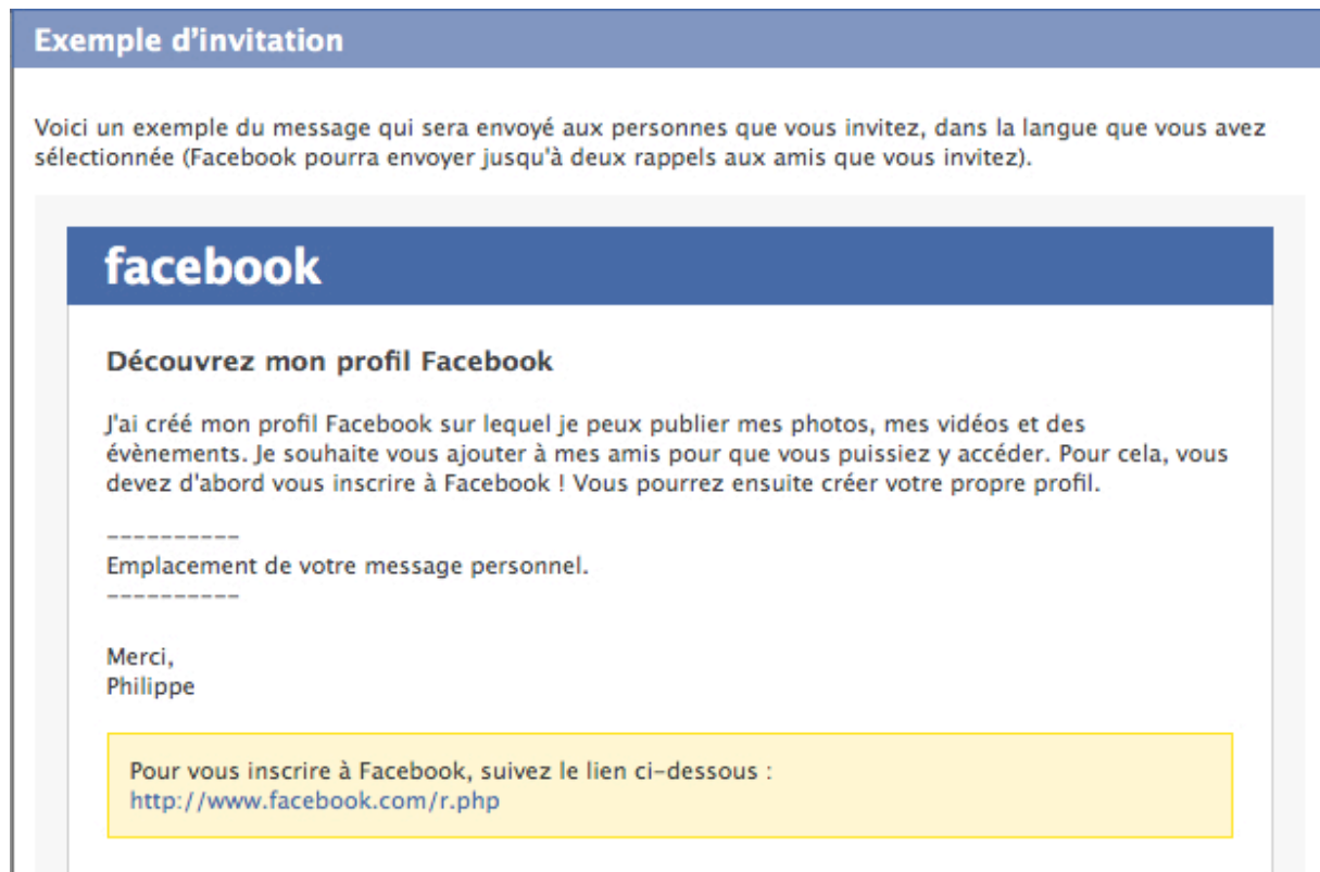
Figure 5 : Modèle d'invitation suggérée par Facebook

De cet exemple on tire l'enseignement que loin d'être une opération simple, l'interaction avec un Distic 4 comme Facebook est un processus complexe , qui joue sur les registres de l'ergonomie matérielle et logicielle, sur la sémiotique, sur la langue et sur les images, le tout dans un contexte culturel qui n'est pas neutre.