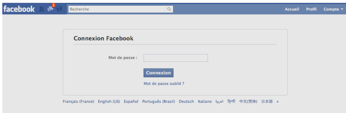
Figure 2 : le cadre de l'interaction avec le logiciel Facebook

Prenons un de nos étudiants qui fait partie des millions d'utilisateurs de Facebook . Comment en est-il arrivé à interagir avec des centaines « d'amis » ? D'abord il a entendu parler de Facebook. Il est à ce titre immergé dans un groupe social de personnes qui pratiquent ou ont entendu parler de Facebook. Ensuite il a dû ouvrir son ordinateur, interagir avec le clavier et l'écran. Puis il a ouvert son navigateur. Il est allé sur la boîte de dialogue ou il a interagit avec le logiciel, c'est-à-dire qu'il a lu les textes affichés, il a rempli la zone appropriée avec sa requête, i.e. « Facebook ». Il a lu les réponses et a cliqué sur l'une d'entre elles. A moins que son navigateur ait déjà enregistré une requête similaire et ait immédiatement proposé le site Facebook.com, interaction donc court-circuitée.