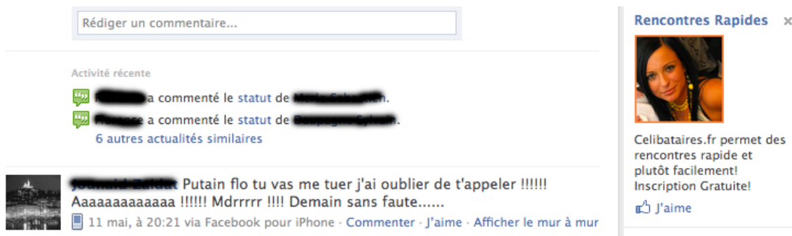
Figure 4 : le style d'une interaction

Une fois dans le réseau, les interactions deviennent littérales, et le style prend une tournure caractéristique comme dans la Figure 4. On entre dans des rites d'interactions au sens de Goffmann (1974).