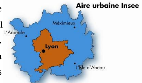
Fig. 2 – Le périmètre du Scot lyonnais et de l'Aire Urbaine défini par l'INSEE

Dans le cas français, l'agglomération lyonnaise a élaboré son Schéma de Cohérence Territoriale – le SCOT, qui a été arrêté en 2008 et validé en 2010. Néanmoins, le SCOT lyonnais qui a été élaboré ne couvre pas le périmètre métropolitain de l'agglomération, en allant au contraire de ce que le législateur avait prévu dans le texte légal 4 . Il couvre le territoire de la Communauté Urbaine de Lyon, la Communauté de Communes de l'Est Lyonnais, la Communauté de communes du Pays de l'Ozon et les communes de Toussieu, Marennes, Saint-Pierre de Chandieu et Chaponnay. (Fig. 2 et 5).