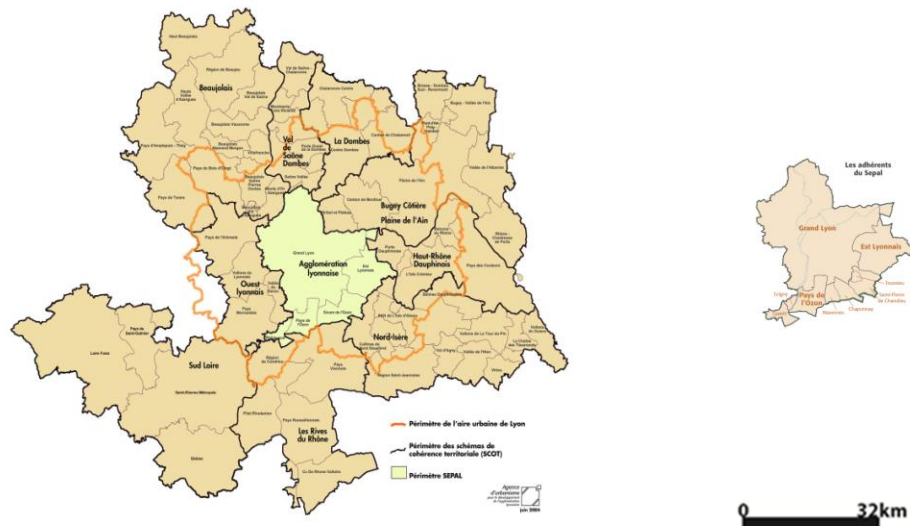
Figures 4 et 5 – L’Aire métropolitaine lyonnaise (le territoire de l’Inter Scot) et le territoire du Scot lyonnais

En fait, quand l’on positionne les cartes dans la même échelle, il y a une visible différence entre la taille du territoire porté par les plans.