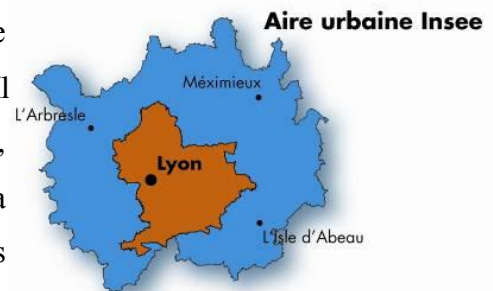
Fig. 2 – Le périmètre du Scot lyonnais et de l'Aire Urbaine défini par l'INSEE

Dans le cas français, l'agglomération lyonnaise a élaboré son Schéma de Cohérence Territoriale – le SCOT, qui a été arrêté en 2008 et validé en 2010. Néanmoins, le SCOT lyonnais qui a été élaboré ne couvre pas le périmètre métropolitain de l'agglomération, en allant au contraire de ce que le législateur avait prévu dans le texte légal 4 . Il couvre le territoire de la Communauté Urbaine de Lyon, la Communauté de Communes de l'Est Lyonnais, la Communauté de communes du Pays de l'Ozon et les communes de Toussieu, Marennes, Saint-Pierre de Chandieu et Chaponnay. (Fig. 2 et 5).