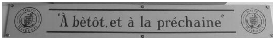
Figure 3 : Message d'au revoir aux passagers embarquant à Elizabeth Harbour

Le Jèrriais fait également l'objet d'une promotion en termes d'affichage public (Fleury, 2009). La traduction de différents messages, annonces publicitaires, panneaux retraçant l'histoire de l'île par exemple, constitue une autre tâche dévolue à l'Office (fig. 3).