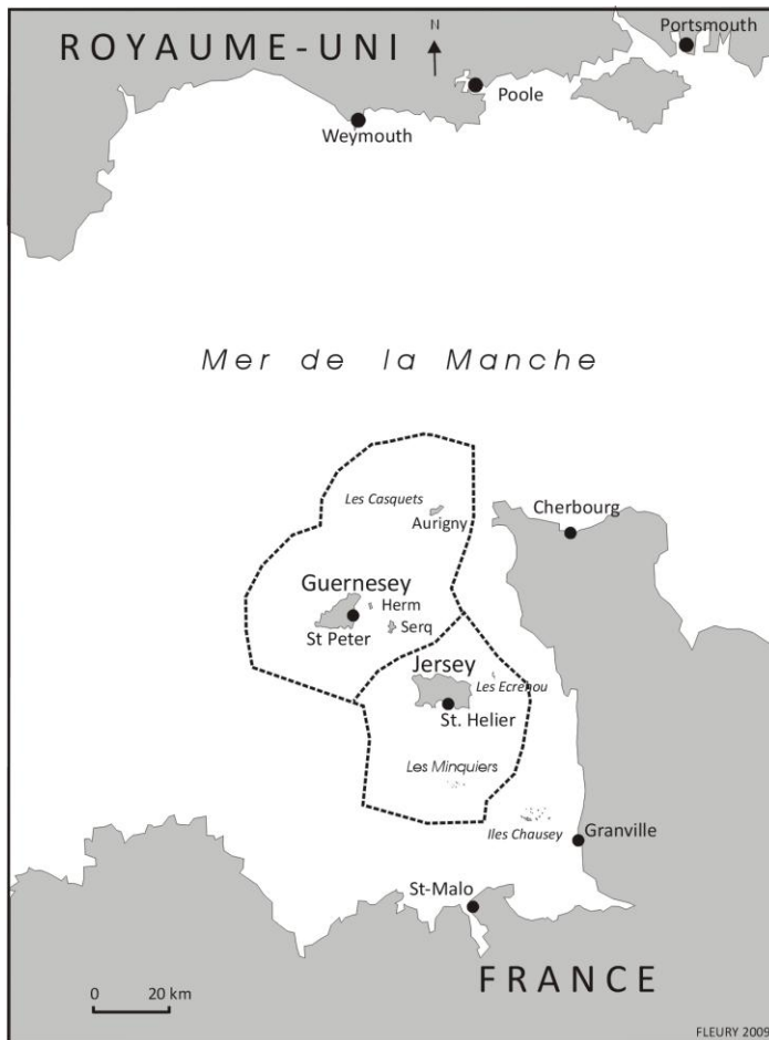
Figure 1 : Localisation de Jersey

Avec ses 116 km 2 , l'île de Jersey – constitutive du bailliage du même nom avec les plateaux rocheux inhabités des Minquiers et des Ecrehou - est la plus grande des îles Anglo-normandes 1 . C'est aussi la plus proche des côtes françaises, dont 24 kilomètres seulement la séparent (fig. 1).