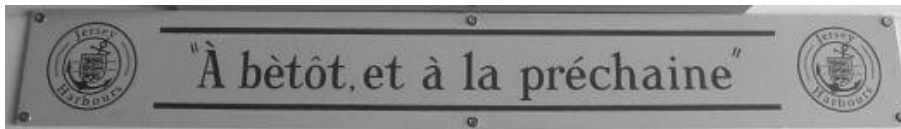
Figure 3 : Message d'au revoir aux passagers embarquant à Elizabeth Harbour

Le Jèrriais fait également l'objet d'une promotion en termes d'affichage public (Fleury, 2009). La traduction de différents messages, annonces publicitaires, panneaux retraçant l'histoire de l'île par exemple, constitue une autre tâche dévolue à l'Office (fig. 3).