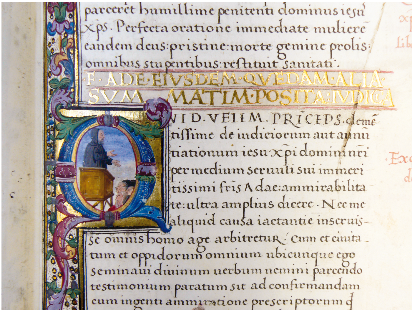
Fig. 3 : Adamo di Montaldo, Coll. privée, fol. 76r (détail)