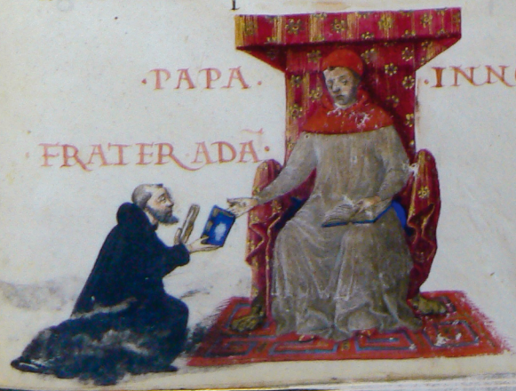
Fig. 2 : Adamo di Montaldo, Coll. privée, fol. 82r