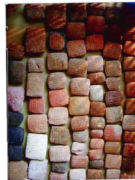
Fig. 4: Tablettes découvertes à Kaniš en 1993, archives d’Aššur-taklāku.

Néanmoins, les bénéfices réalisés chaque année par les Assyriens profitent à l’ensemble de la population de la ville, à ses temples, qui mettent des capitaux à la disposition des marchands, et à ses institutions gouvernementales, clairement impliquées dans les échanges commerciaux. À la variété des métiers commerciaux – banquiers, agents, transporteurs –, s’ajoutent ceux qui ont un lien plus ou moins direct avec les échanges à grande distance, comme les artisans du textile et du cuir (sacs et harnais), les éleveurs d’ânes, les messagers 38 ... Les éponymes d’Aššur, choisis parmi les grandes familles de la ville, mentionnés dans les textes de Kaniš et dont plusieurs listes ont été récemment identifiées 39 , exercent différents métiers qui n’ont pas tous un lien avec le commerce: batelier, fabricant d’armes, pourvoyeur de beurre, mais on y trouve aussi des éponymes tamkārûm .