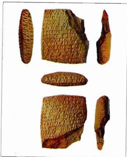
Fig. 3: Lettre adressée à Aššur-taklāku par Tariša.

Certains verbes sont en effet détournés de leur sens propre pour donner véritablement vie à l'argent ou aux tablettes ayant une valeur économique 30 . Ainsi, les créances, une fois remboursées, «sont tuées» ou «meurent», c'est-à-dire qu'elles sont annulées. L'argent doit être en per-