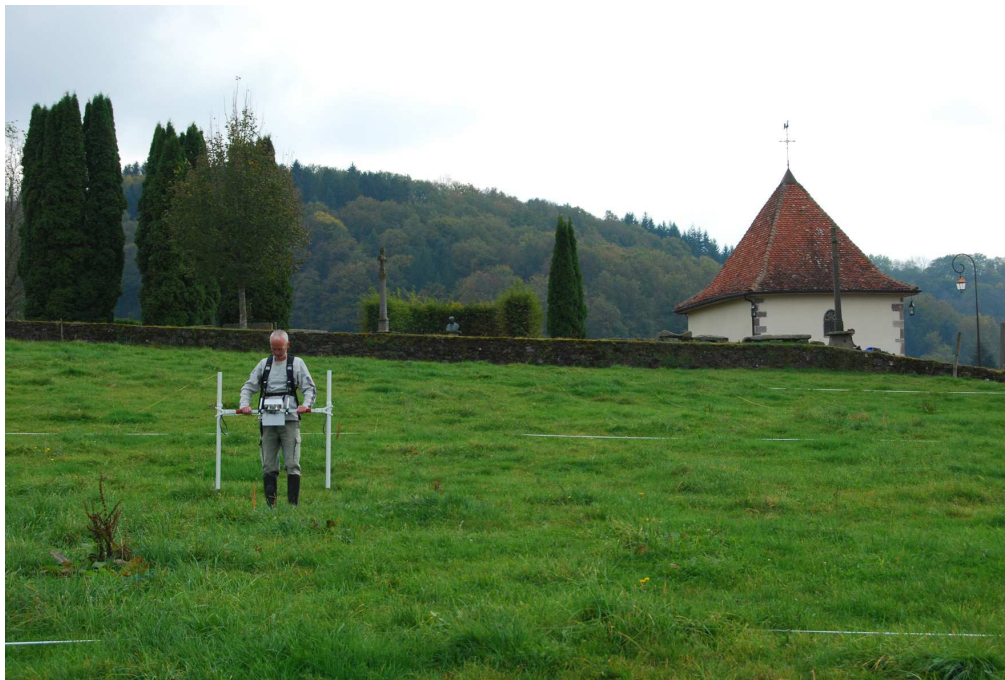
Fig. 2 - Annegray, prospection géophysique sur le flanc nord de la butte.

d'Annegray). C'est dans ce champ que des structures circulaires avaient été observées depuis le point de vue dominant de l'église Saint-Martin de Faucogney 3 . La surface étudiée a été divisée en trois secteurs, représentant un peu plus de 4 hectares. Seul le secteur n° 1, au nord de la butte, a révélé des vestiges et fait par conséquent l'objet d'une description. La méthode géophysique mise en œuvre à Annegray est celle de la magnétométrie à haute résolution ; les instruments utilisés sont deux Bardington Crad 601, l'un à gradiomètre unique et l'autre à gradiomètre double (fig. 2). Dans le même temps, nous avons dressé un relevé au tachéomètre laser des vestiges de l'église Saint-Jean-Baptiste et un relevé topographique du site.