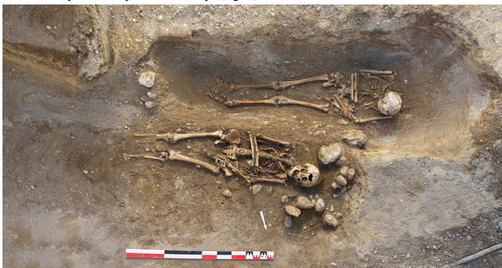
Fig. 3 - Champagnole, la sépulture n° Sp. 1 superposée partiellement à la sépulture n° Sp. 21.