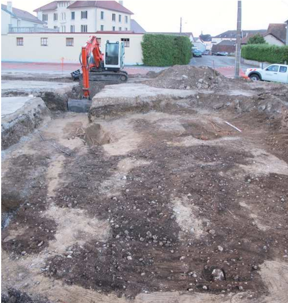
Fig. 1 - Champagnole, vue du cimetière en cours de dégagement.