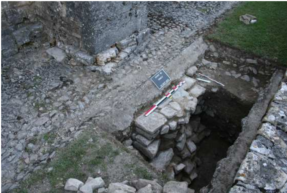
Fig. 1 - Gigny-sur-Suran, sondage 2, vue du sondage et du contrefort de l'église (CEM, 2010).