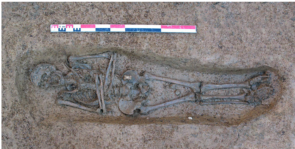
Fig. 4 - Gigny-sur-Suran, la sépulture présente dans le chœur de l'église.