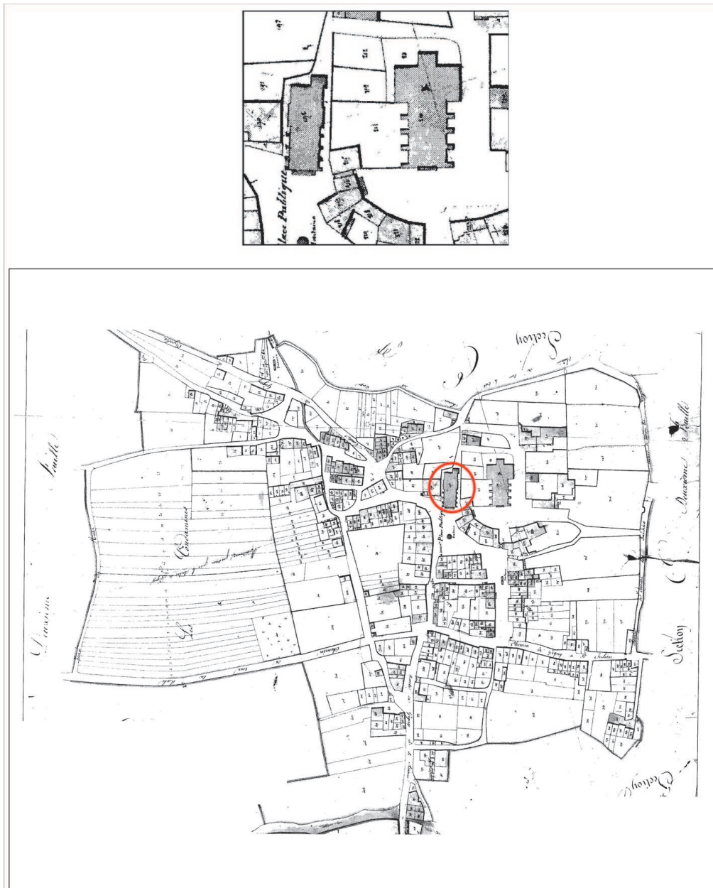
Fig. 1 - Gigny-sur-Suran, localisation de l'église paroissiale sur le cadastre napoléonien (Dao D. Billoin, Inrap).