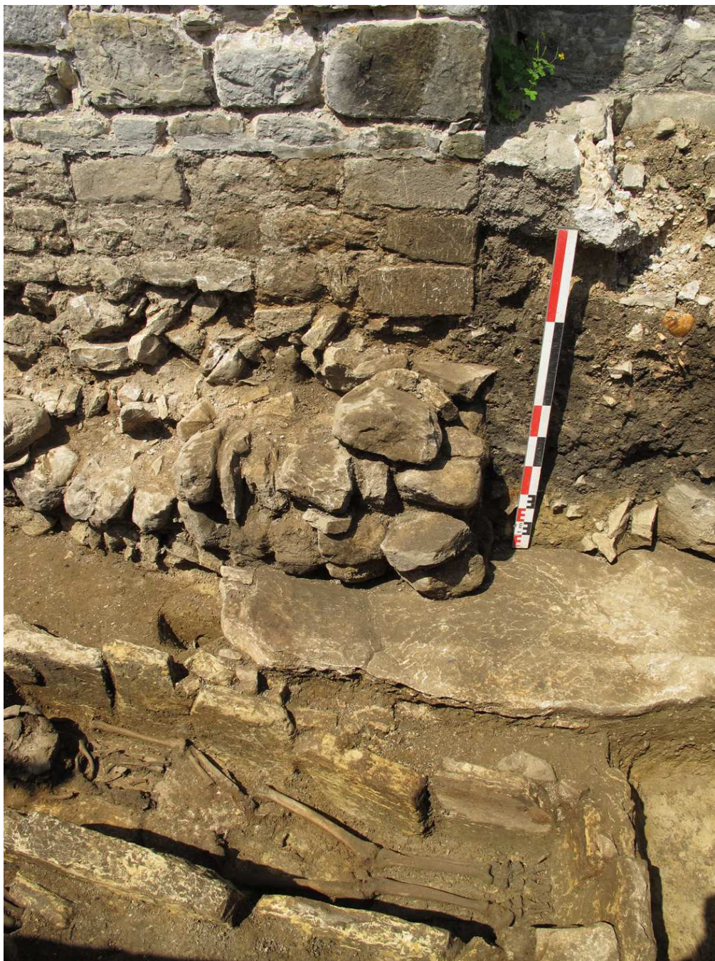
Fig. 3 - Saint-Hymetière, vue d'ensemble du sondage n° 4, avec les vestiges d'un édifice antérieur à l'église romane s'appuyant sur le couvercle d'une tombe mérovingienne (cl. D. Billoin, Inrap).

à une date postérieure. La superposition parfaite de l'église romane avec cette maçonnerie évoque fortement la présence d'un édifice religieux antérieur, peut-être la cellula restituée le 4 décembre 861 par Charles le Chauve.