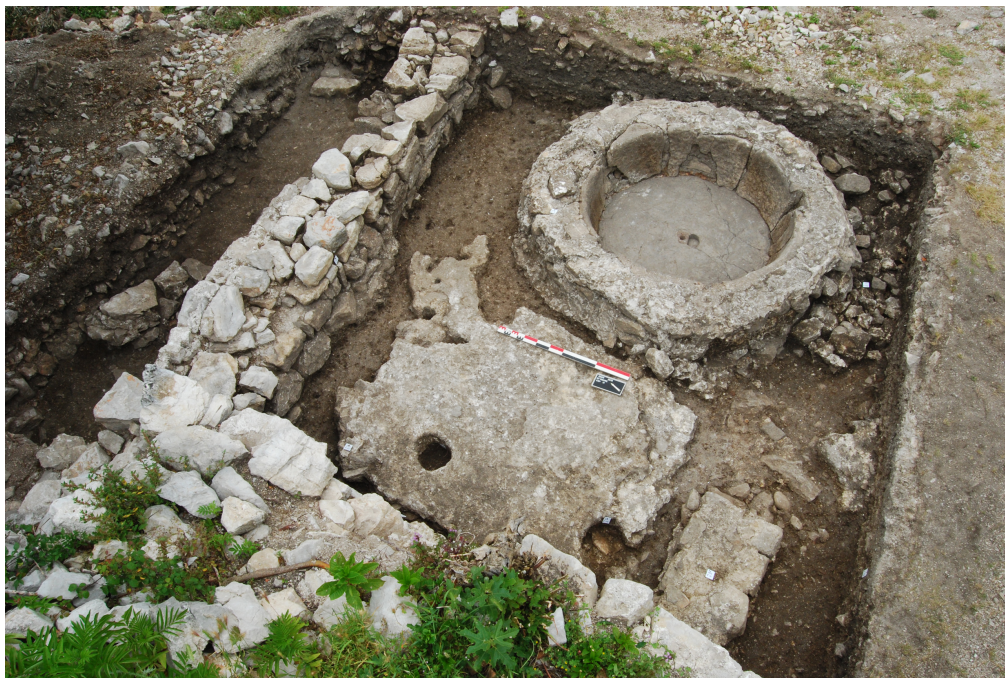
Fig. 3 - Osor, sondage dans le secteur IV ; détail du fragment de sculpture remployé dans la tombe maçonnée.