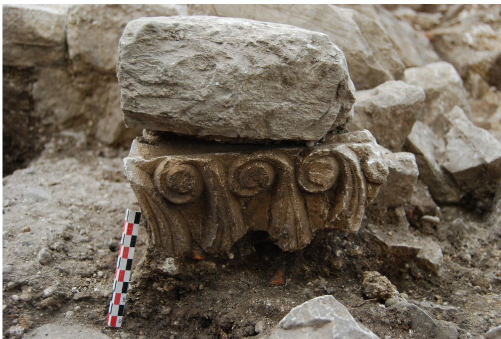
Fig. 2 - Osor, vue depuis l'ouest de la structure circulaire (fouloir ?) découverte dans le sondage du secteur VI.