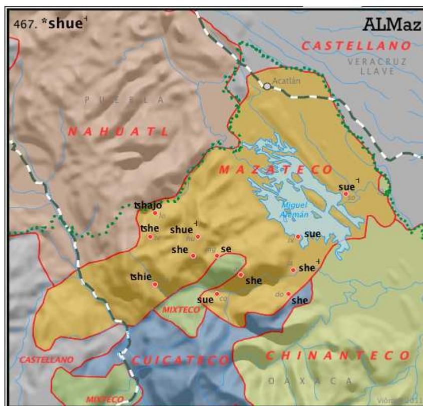
Figure 1. Carte Sjue = « chaud » de l'ALMaz (données de Kirk 1966, cartographie Vittorio dell'Aquila) et langues en contact avec le mazatec dans le bassin moyen du Papaloapán

Selon le point de vue, le mazatec peut être considéré aussi bien comme une langue unique, quoique fortement diversifiée, que comme une petite famille de langues. En ce cas, elle serait alors une sous-sous-famille de langues au sein de la sous-famille popolocane de la branche orientale de l'otomangue – qui comprend par ailleurs des langues comme le zapotec, le mixtec, le triqui, l'amuzgo. Les autres langues popolocanes sont l'ixcatec, le chocho ou ngigua, et le popoloca – les deux dernières présentent également une gamme de lococlectes ou variétés géoclectales (v. Gudschinsky 1958a).