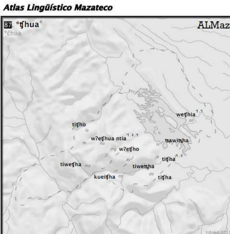
Fig. 3. Type wechja « (il/elle) ferme », données de Kirk (1966) pour l'ALMaz, carte Vittorio dell'Aquila (CELE)

Une fois effectuée l'extraction du radical en oblitérant les proclises aspectuelles, le tableau des options structurales fait alterner les classes O et A avec une réduction à la racine nue pour trois variétés (Ja Do Lo) – dans ce cas, il est probable que le proclitique aspectuel devient préverbe de classe flexionnelle par défaut : tí=chja , tí=chjo > tí-chja , tí-chjo .