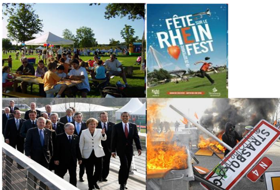
Illustration 4. La diversité de l'appropriation symbolique des lieux

L'aménagement paysager et la symbolique (trans)frontalière ont par ailleurs assuré une visibilité élargie au jardin. La passerelle est communément utilisée pour illustrer la