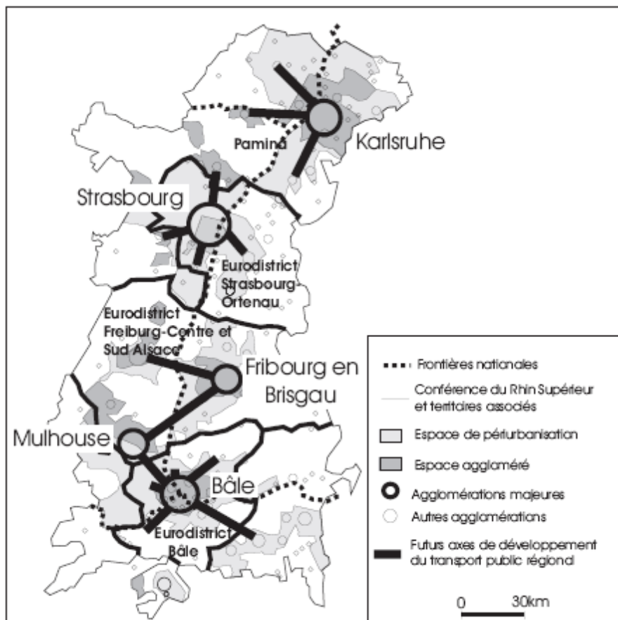
Carte 1. Vers l'interconnexion transfrontalière des systèmes de transport

On voit que les développements des systèmes de transport conduisent à rapprocher les systèmes de transport qui devront progressivement répondre aux exigences de continuité des services, d'interopérabilité des matériels et d'intégration tarifaire. Les accords et les expériences partagés qu'il suppose conduiront à faire émerger sur les rives du Rhin un modèle original qui empruntera aux différentes cultures de transport, selon des arrangements qu'il reste à fixer.