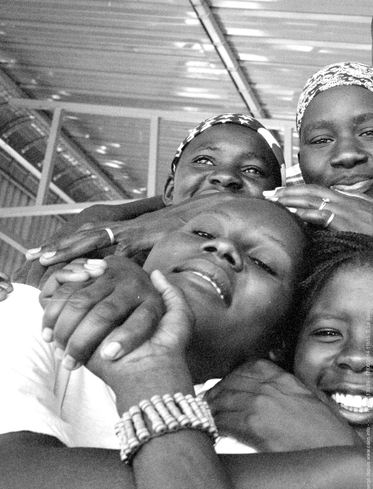
ÉTUDIANTS ORIGINAIRES DE DIFFÉRENTES RÉGIONS DE L'UGANDA lors d'une conférence sur la paix organisée par le Mennonite Central Committee.