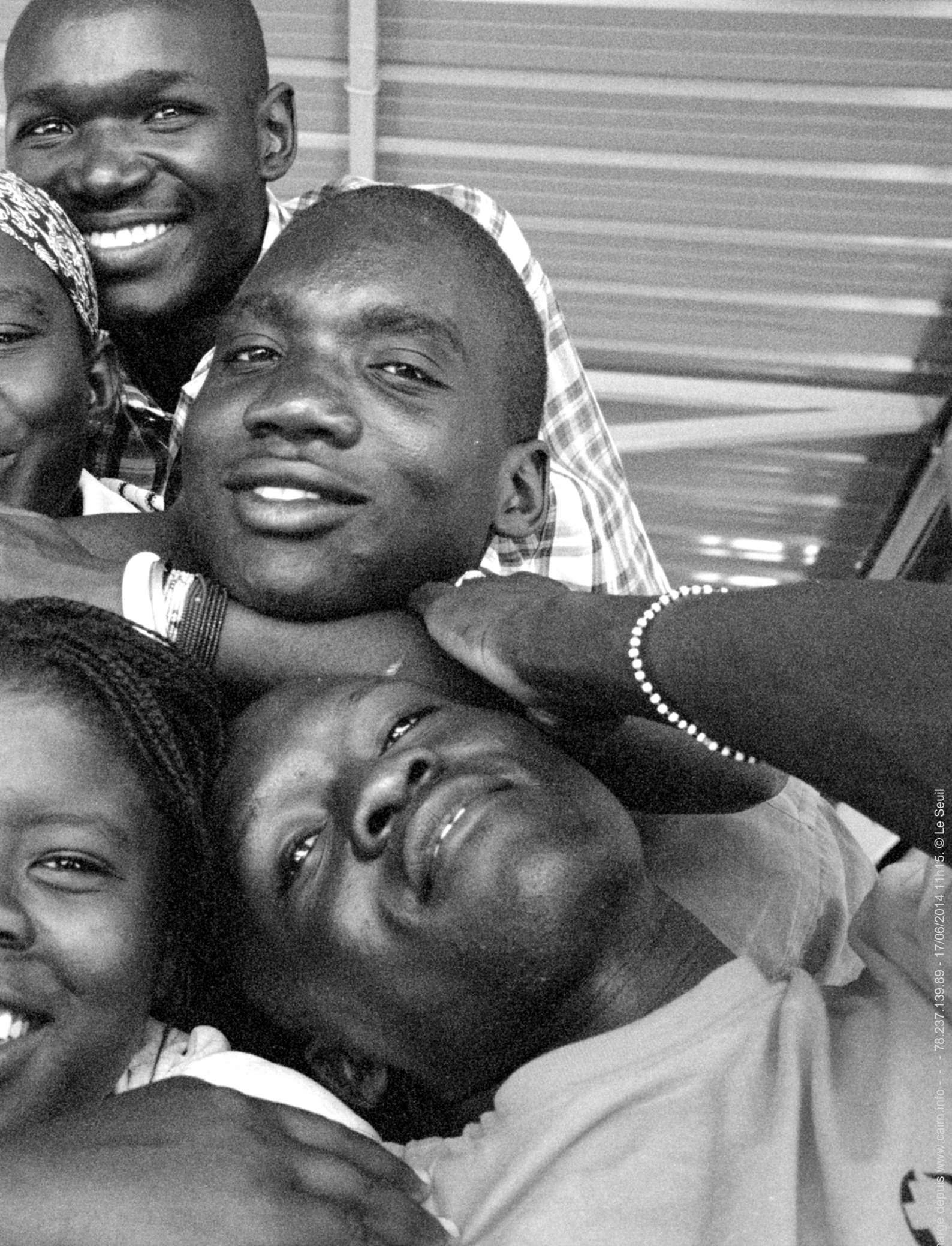
Exercice de « résolution de problème » effectué par les participants, consistant à joindre les mains pour former un « noeud humain ».