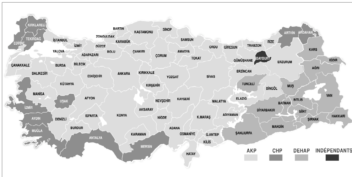
Carte des premiers partis par il , Milliyet, 4 novembre 2002

mieux éduquées. Ainsi, 42 % des diplômés d'université auraient voté pour le CHP, contre seulement 22,4 % pour l'AKP 222 .