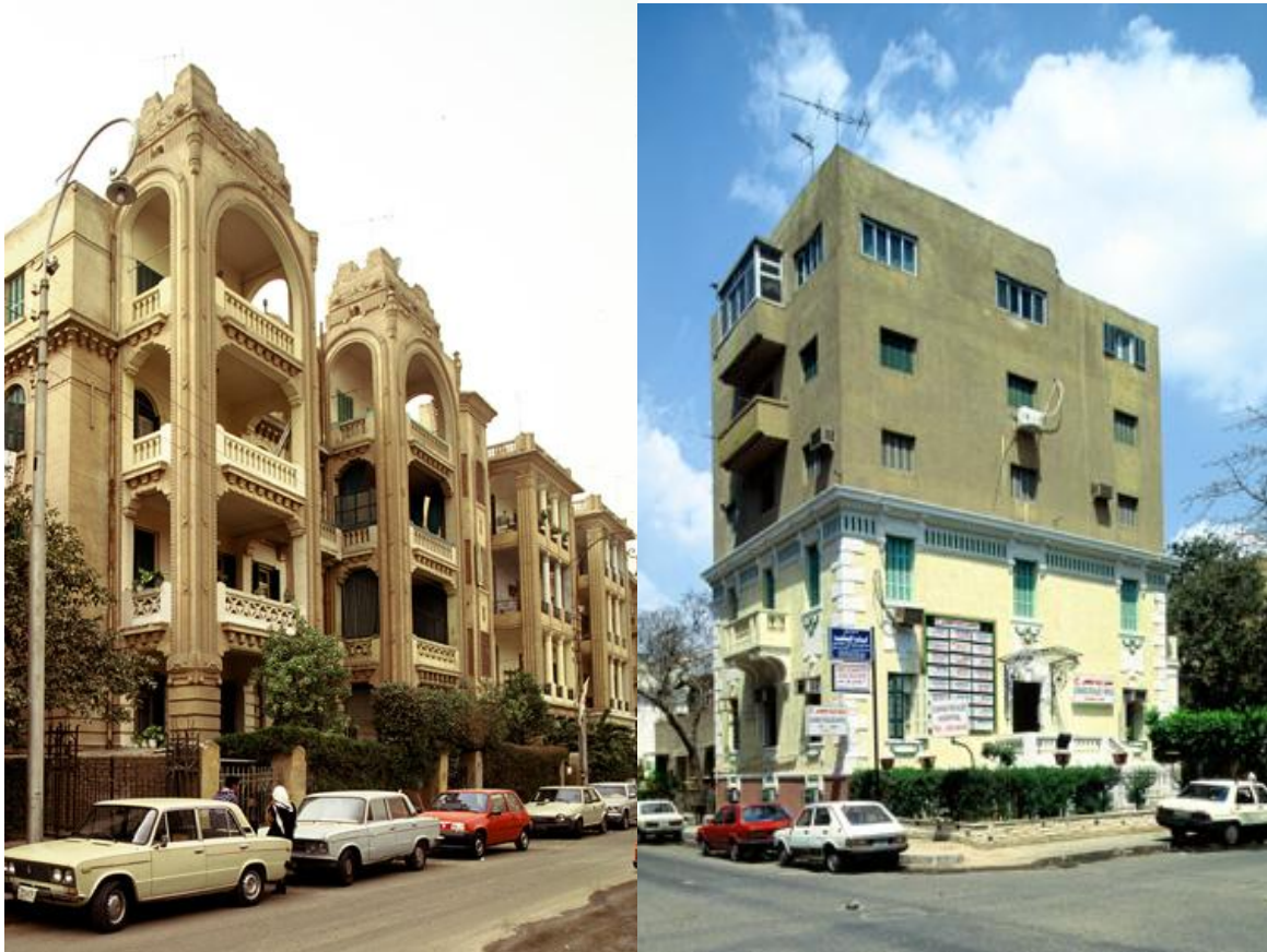
4. Surélévations à Héliopolis : à gauche, l'immeuble Arabian, construit en 1928, surélevé en 1935, à droite, la villa Damadian, construite en 1908, surélevée en 1968 et aujourd'hui utilisée comme clinique.