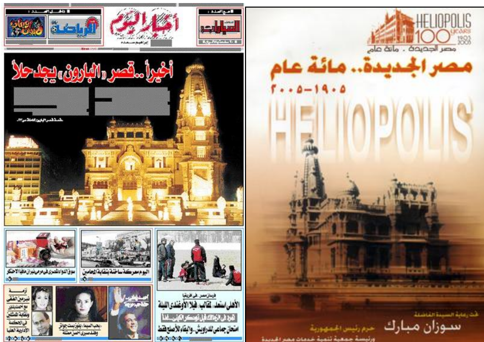
6. « Enfin... une solution pour le palais du « baron », une d' Akhbâr al-Yawm , 15 mars 2005 (à gauche).

type « d'espace public », peu usuel dans le paysage égyptien 76 , et a été pensé comme tel par ses organisateurs. De nouvelles activités sont programmées dans la rue à l'automne 2005 par l'association héliopolitaine.