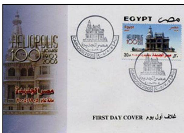
5. Timbre commémoratif du centenaire d'Héliopolis, première émission du 5 mai 2005

héliopolitaine prend forme peu à peu, au gré des idées et des moyens des uns et des autres, et suscite même une certaine émulation. On s'accorde finalement sur une conférence inaugurale, un ensemble de table-rondes, une exposition de photos sous les arcades de la rue Bagdad, un carnaval d'enfants dans la rue, des concerts à l'air libre ; la cérémonie de lancement est fixée au 5 mai 2005 en présence de Suzanne Mubarak. Un timbre commémoratif doit être émis pour l'occasion. Des travaux de peinture sont exécutés à la hâte par le gouvernorat dans les rues principales, dont les immeubles reçoivent un badigeon homogène et pimpant de couleur crème. Plus original, des caches en métal ajouré sont conçus pour rendre moins visibles les hordes de climatiseurs qui animent habituellement les façades égyptiennes. Des vues anciennes d'Héliopolis sont placardées dans plusieurs rues.