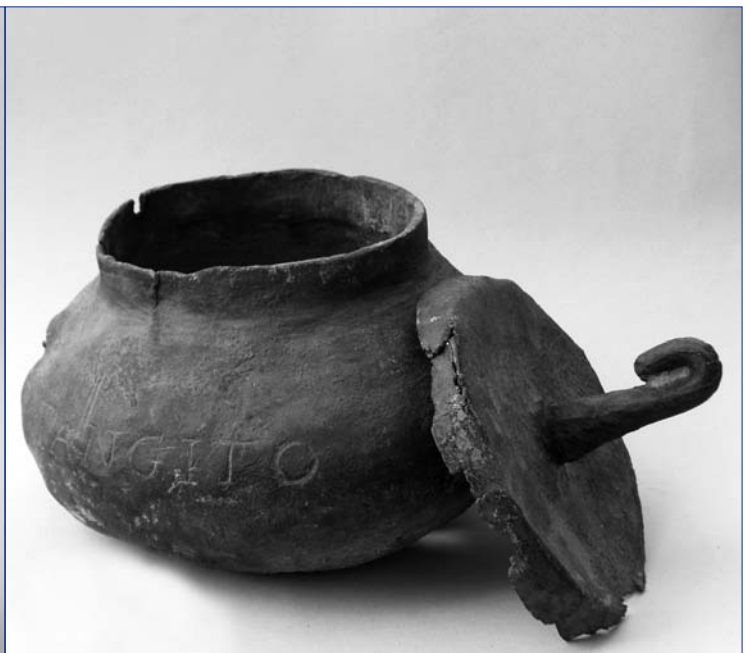
Fig. 1 et 2 — Urne en plomb inscrite avec son couvercle en place ; ht. de l'urne seule : 135 mm, Ø max. 210 mm.