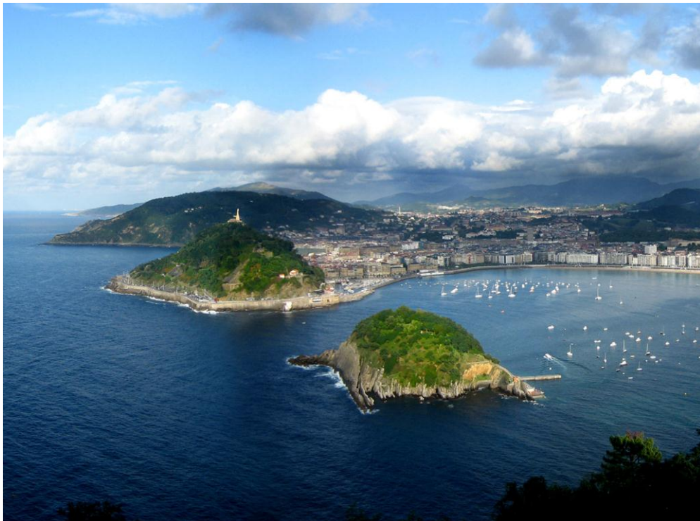
Donostia, Saint-Sébastien : l'Urgull, l'île de Santa Clara et la Concha depuis le Mont Igeldo

Ici, l'Atlantique achève sa course à l'Est. Il a lissé le Jaizkibel, creusé les abysses de Pasaia, ciselé l'Urgull et l'Igeldo, dessiné des plages de cartes postales – Zurriola, La Concha, Ondarreta –, isolé l'île de Santa Clara, repaire halluciné dans la baie, abrité le port des Koxkeros. Ici, l'Océan inonde de pluies obstinées l'arrière-pays montagneux, sépare le monde des traîniers de celui des piolets, instaure la frontière. La frontière, ici, n'est pas celle, nord-sud, des prérogatives étatiques, mais celle que dessine la rencontre du sable et du sel, du chêne et des embruns, de la mouette et de l'épervier. Elle débride le regard, ouvre l'horizon : place toute vie d'ici sous le sceau du départ.