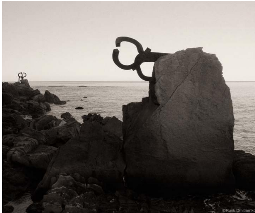
Eduardo Chillida, Peines del Viento, Saint-Sébastien