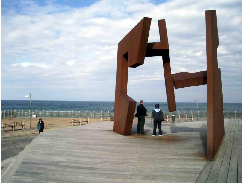
Eraikuntza hutsa , de Jorge Oteiza, Saint-Sébastien

http://commons.wikimedia.org/wiki/File:Donostia_Oteiza_Eraikuntza_hutsa.jpg?uselang=fr