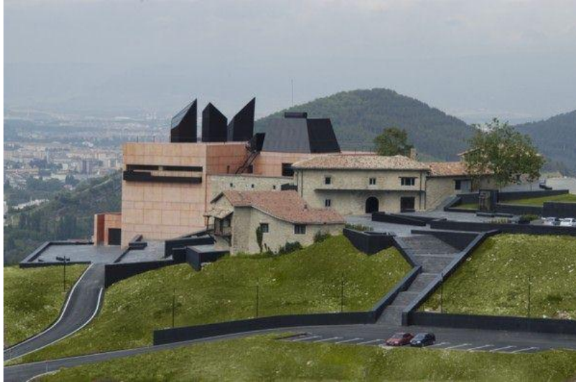
Fondation Musée Oteiza sur les hauteurs d'Alzuza (Navarre) Architecte : Francisco Sáenz de Oiza

Dans ses Exercices spirituels dans un tunnel (1965) auxquels il donna une forme définitive en 1984, nous apercevons Oteiza en quête d'une âme basque. Il est dans son laboratoire. Il plie ces morceaux d'insignifiance que sont ces trombones qui gisent sur nos bureaux. Non pas d'un geste machinal mais dans le souci constant de transformer la matière. Dans la répétition des jours, ces exercices lui font faire de ces morceaux de métal de surprenantes sculptures que l'on regarde aujourd'hui comme des œuvres d'art. Rien d'autre, au fond, qu'un détournement d'usage, un pacte conclu avec le matériau bureautique pour l'arracher à son destin tragique. Ce geste prend racine dans une attention singulière portée à notre environnement afin de faire de l'ordinaire de nos occupations une œuvre d'art qui change aussi notre regard sur le monde. Patient travail de l'ascèse.