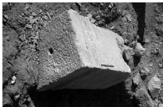
Figure 2. Mortaise de fixation.