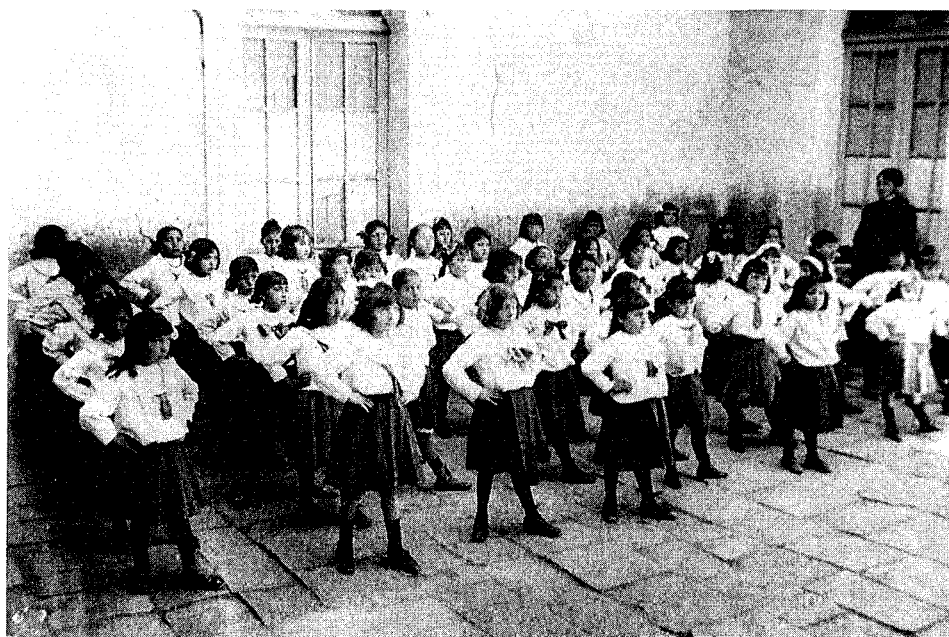
Fig. 1 - Niñas haciendo gimnasia, Oruro, 1915.

Estas consideraciones se difundieron y rápidamente se expresaron en los discursos oficiales, en la prensa y en las revistas educativas, como producto de un consenso general de las élites pensantes. No fueron exclusivas de los Liberales bolivianos. Tampoco eran un invento o hallazgo suyo: venían junto con el auge y éxito de la corriente europea de la “educación integral”.