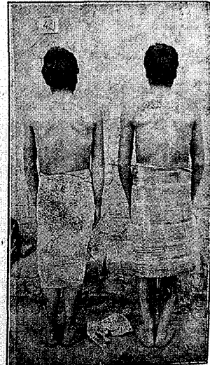
PL. 74. — Les mêmes vus de dos.