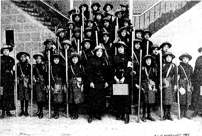
Fig. 4 - Primera brigada de girls-scouts, Oruro, 1915 (col. G. de Medinaceli).

objetivo de transformarlo físicamente hacia los cánones de belleza, de fuerza y equilibrio puramente suecos. A veces esta búsqueda de belleza era el único argumento