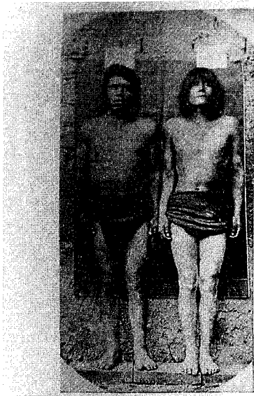
FIG. 19. — Types d'Indiens Quitchouas de la Finca de Potolo.