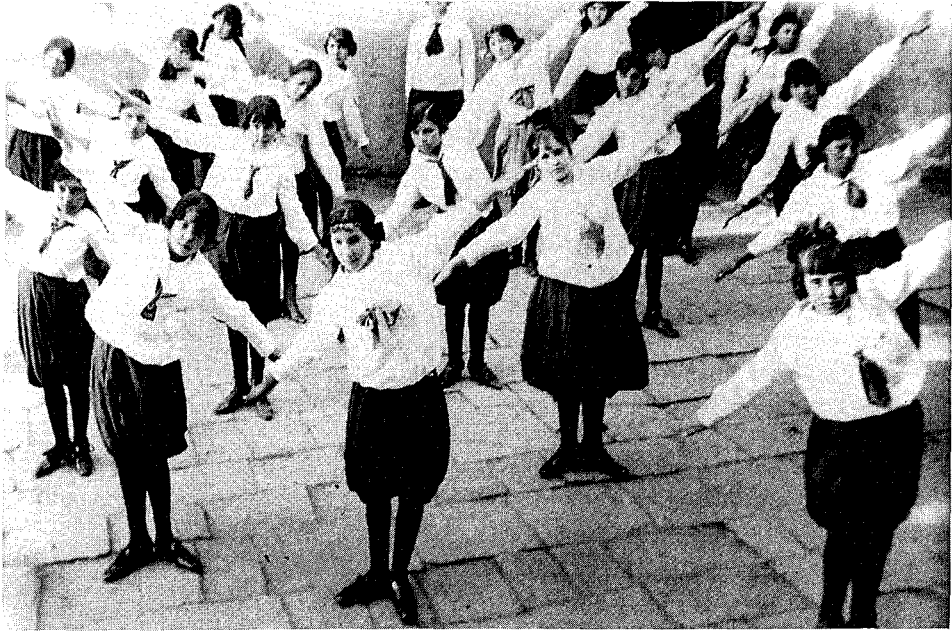
Fig. 2 - Niñas haciendo gimnasia, Oruro, 1915.