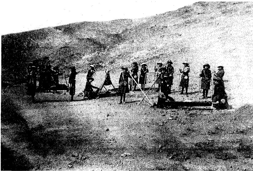
Fig. 5 - Girls-scouts en campamento.

(24) El 2 de junio de 1915, el ministro de instrucción Aníbal Capriles, mandaba a su iniciadora sus felicitaciones (Ministerio de Instrucción Pública, 1915, in Colección Gutiérrez de Medinaceli).