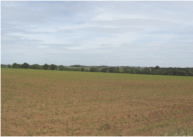
Photo 1 - Le plateau des Mauges aux environs du Pin-en-Mauges. Le plateau, à 130 m d'altitude, constitue une plateforme d'une remarquable régularité. Ici dans sa partie nord, il domine d'une centaine de mètres la Loire, en fonction de laquelle s'incisent vigoureusement les « coulées » affluentes du fleuve