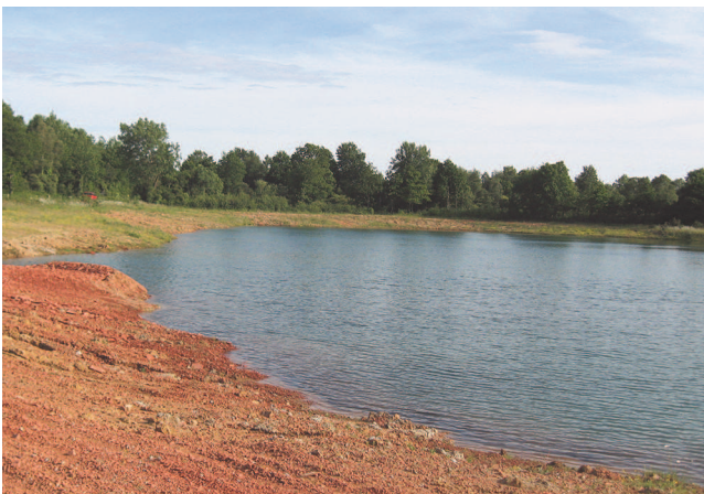
Photo 2 - Argillère au Fuiet dans les Mauges. Les argilières abandonnées sont aujourd'hui ennoyées ; situées pour partie en lisière de forêt, elles sont fréquemment végétalisées, et constituent des lieux reconnus d'intérêt écologique, participant ainsi du patrimoine naturel lato sensu

et humides. La tuilerie abandonnée du village des Roseaux, au nord de la commune de Vallet, jouxte une ancienne aire d'extraction, reconnaissable à ses argilières ennoyées aux formes géométriques. Cette aire voisine d'environ 500 m le village des Tuileries situé sur le territoire commu-