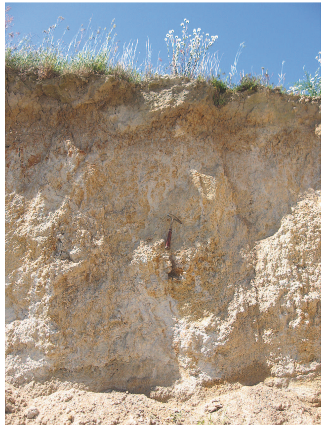
Photo 3 - Le plateau des Mauges, à 130 m d'altitude, se prolonge vers l'ouest par une surface inclinée qui atteint 45 m aux portes de Nantes. Au lieu-dit La Poterie (Château-Thébaud), aujourd'hui englobé dans la couronne périurbaine, le socle granitique est profondément altéré et livre les argiles de l'ancienne exploitation desquelles témoigne la toponymie

Une incursion aux marges du présent secteur d'étude permet d'en accroître la portée géomorphologique : à la sortie sud de Nantes, sur l'ultime prolongement du plateau des Mauges, nous avons observé, à l'occasion de travaux de terrassement, le socle très altéré sous forme d'argiles au carrefour du Butay, 2 km au sud-ouest d'un lieu-dit La Poterie, en limite de la commune de Château-Thébaud (photo 3). De surcroît, le socle y est recouvert de blocs de grès ladères épars,