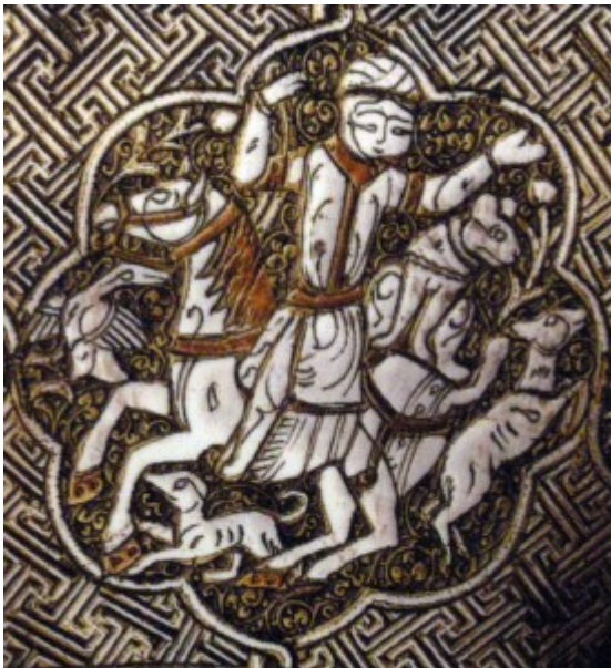
Chasse à cheval, avec guépard assis derrière le cavalier. Aiguière Blacas (détail), vers 1232, Irak, Mossoul. British Museum, ME OA 1866.12-29.61

Les connaisseurs déclarent que les guépards de la Samāwa sont les meilleurs pour la chasse en battue fermée ( halqa ), alors que ceux d'Égypte leur sont supérieurs en courre libre, mais moins beaux de robe. Les guépards égyptiens ont un port plus altier et sont plus allongés de corps, ce qui leur permet d'entreprendre la gazelle dorcadé, tandis que ceux de la Samāwa ont des lignes plus gracieuses. La plupart de ces derniers ont la robe blanchâtre aux mouchetures rares, le corps svelte et les membres effilés ; chez eux, le mâle est meilleur preneur que la femelle, mais celle-ci reste de beaucoup la plus belle de toute l'espèce et elle se montre infatigable à la course ; il se trouve même certaines femelles capables de tenir le train après les gazelles une journée entière. Ces guépards ont longue échine et longue queue ; haussant le col pour aveuer [1] , on les prendrait pour des marionnettes, se retournant, leur échine se love comme un serpent et leur queue, dressée, rappelle une lance. C'est, certes, de toutes les races, la plus belle, la meilleure pour le courre et la plus digne de louanges.