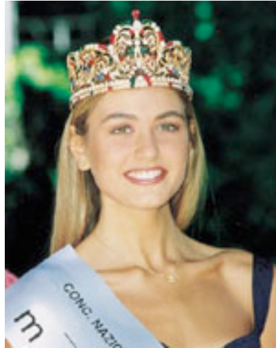
Fig. 2 Arianna David