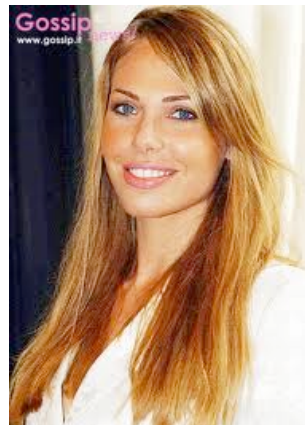
Fig. 5 Ilary Blasi

Montage de photographies de presse dans lesquelles les visages de quatre femmes différentes se révèlent se conformer sur la base d'un modèle unique.