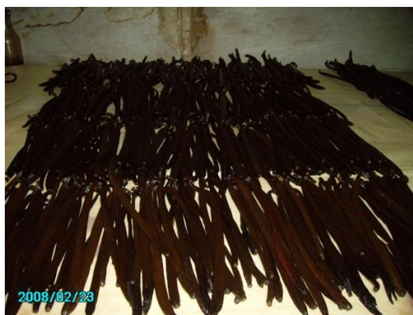
“La vainilla”.

Muchos individuos nos dijeron que los indígenas que vivían en Jicaltepec consumían la vainilla y la cosechaban pero de manera natural. Debían esperar a que una mosca fecundara la flor entonces la cosecha era muy escasa.